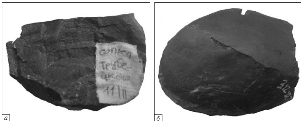
Рис. 1. Глинисто-сидеритові конкреції: а — Малотарханський вулкан (сопка Трубецького), б — грязьовий вулкан Джау-Тепе