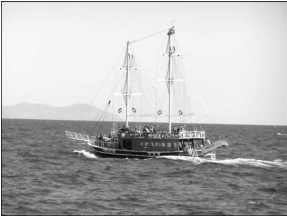
Морская прогулка на яхте

высоком уровне и наглядно продемонстрировал высокий уровень техники для автоматизированного неразрушающего контроля в линиях трубного производства.