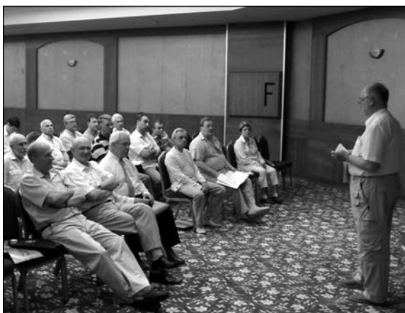
В зале заседаний конференции

В четвертый раз ведущие специалисты в области НК могли напрямую пообщаться как между собой, так и с руководителями предприятий – потребителей средств неразрушающего контроля. В конференции приняли участие представители известных в Украине и за ее пределами предприятий и организаций: Арматор (Днепропетровск); Госпромгорнадзор Украины (Одесса); Диагностические приборы (Киев); ДП-Тест (Киев); Инжиниринговые технологии (Киев); Институт физики полупроводников им. В. Е. Лашкарева НАН Украины (Киев); Институт сцинтилляционных материалов НАН Украины (Харьков); Институт электросварки им. Е. О. Патона НАН Украины (Киев); Национальный техни-