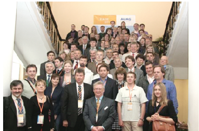
Учасники конференції з геоінформатики, 2012 р.

Оригінальні геоелектричні методи становлення короткоімпульсного електромагнітного поля (СКІП) і вертикального електрорезонансного зон-