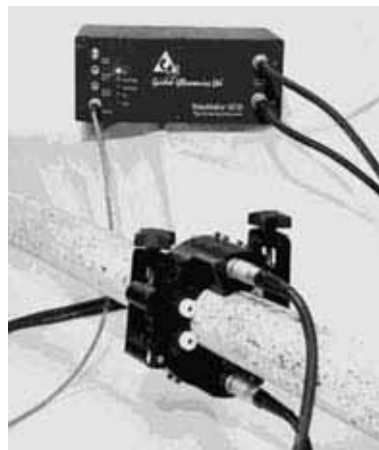
Рис. 4. Система преобразователей и устройство Wavemaker 16 фирмы The Guided Ultrasonics Ltd на трубе 3".

НК — многие разработчики оборудования и технологий перешли на новый уровень применения НК — решают задачи по минимизации затрат на проведение НК.