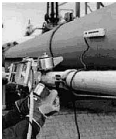
Рис. 3. Сканер для измерения остаточной толщины стенки трубы методом магнитных полей рассеивания.