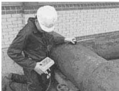
Рис. 1. Портативное устройство АСFM контроля сварных швов.