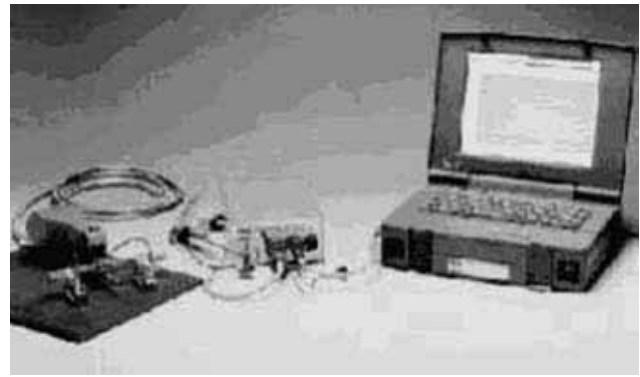
Рис. 5. Прибор, реализующий TOFD метод, производства фирмы RTD.

На заседании секции «Надежность и верификация процедур» обсуждались проблемы сертификации методик, оборудования для НК и получаемых с его помощью результатов контроля, аккредитации сервисных организаций, выполняющих работы по НК. Этим вопросам уделяется большое внимание, так как доверие к результатам НК непосредственно связано с организацией НК, которая зависит от технологии контроля, используемой аппаратуры, ал-