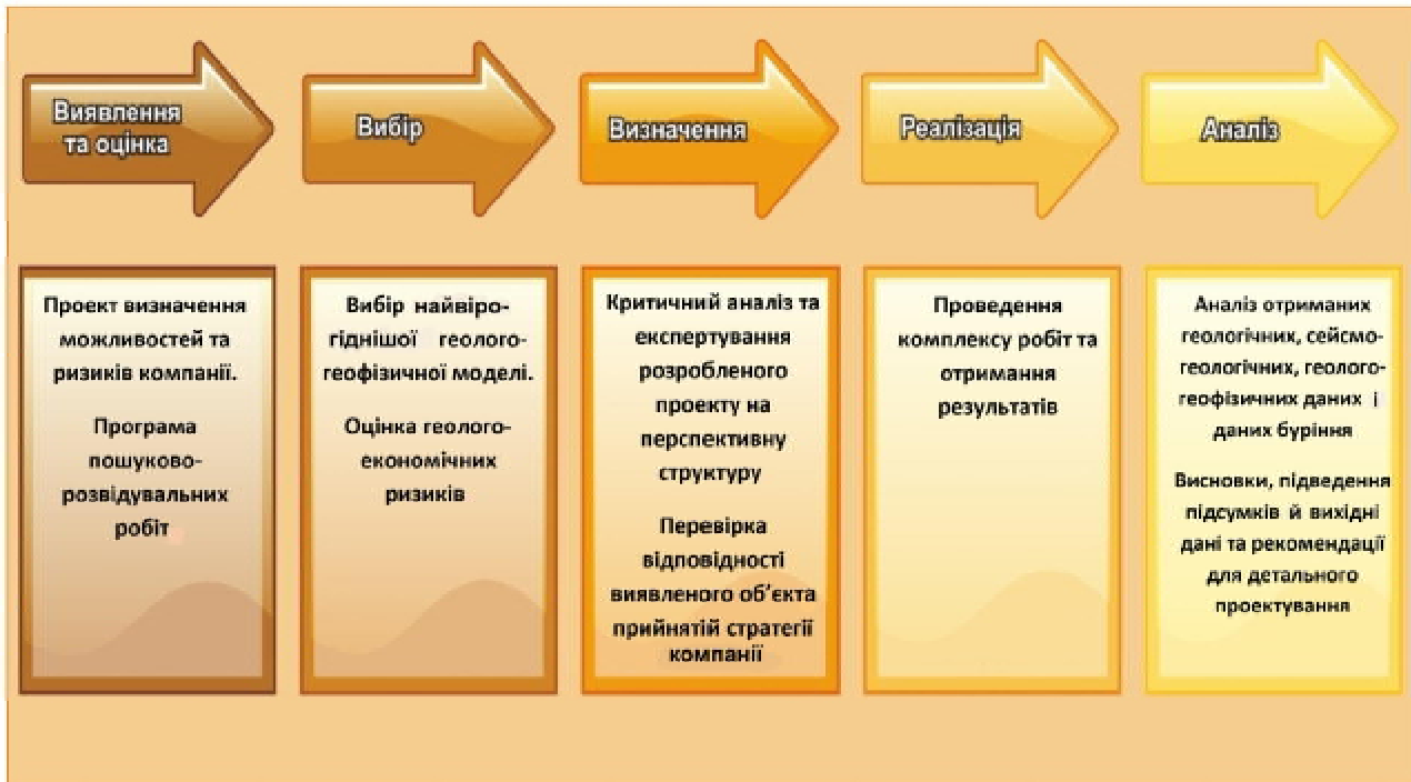
Рис. 1. Концептуальна схема процесу пошуково-розвідувальних робіт

пертів, порівнюють обсяги і види відповідних робіт згідно з проектом, здійснюють критичний розгляд і затвердження оцінки ресурсів, аналіз і подальше вивчення відкритих ресурсів.