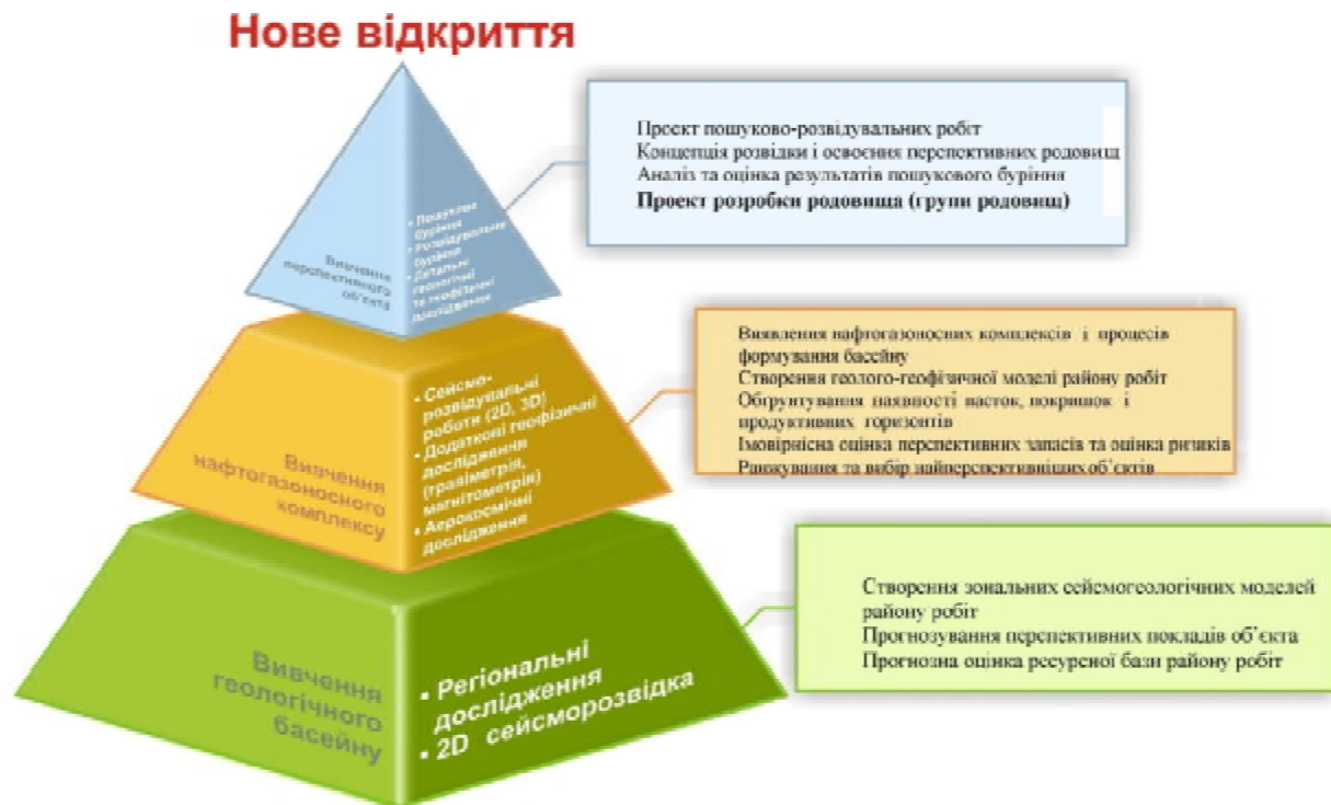
Рис. 2. Принципова схема проведення геологорозвідувальних робіт

ризиками, у першу чергу геологічними, а також із техніко-технологічною можливістю реалізації проекту в найкоротший час.