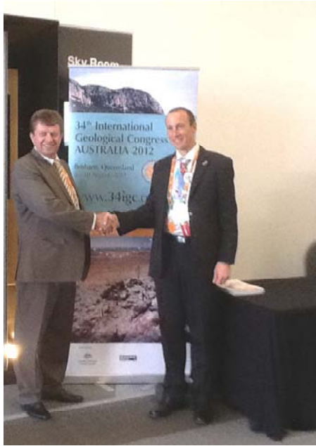
Зустріч М.А. Якимчука з новообраним віце-президентом МСГН, директором Геологічної служби Словенії Марко Комаком

Наукова програма 34-ї сесії МГК була підготовлена програмним комітетом (очолюваним Lynton Jaques, Geoscience Australia), за участю МСГН, авторитетних учених і координаторів тем. Про насиченість програми свідчить той факт, що за 5 робочих днів, проведено близько 220 симпозіумів і понад 400 сесій (приблизно 30–35 засідань за день). На щоденних пленарних засіданнях “Гаряча тема” з доповідями виступали видатні експерти-геологи із різних країн, які позначили проблеми, що стоять перед геологами як Австралії, так й інших країн світу ( http://www.34igc.org/program-timetable.php ). Саме ці теми були в центрі уваги проведення конгресу і подіях, які відбувались у його рамках і становили неабиякий інтерес для представників ЗМІ.