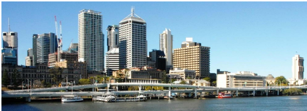
Сучасна архітектура м. Брісбен

Урочистий прийом гостей на честь відкриття найвищого форуму світової геологічної спільноти