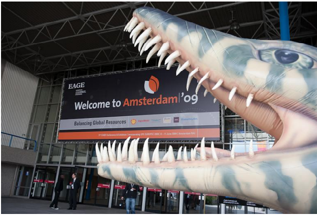
Виставковий комплекс RAI – головний вхід на конференцію

ставниками різних компаній, довідатися про їх досягнення та новітні розробки.