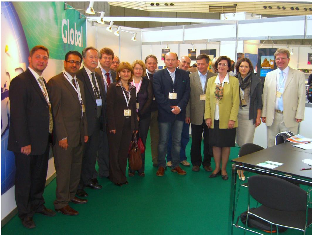
Зустріч представників EAGE–PACE фонду с делегатами, що отримали фінансову підтримку

EAGE готово співпрацювати з науковцями з України. Вона широко відкриває нам такі можливості. Закликаємо всіх зацікавлених фахівців України взяти участь у IX міжнародній конференції “Геоінформатика: теоретичні та прикладні аспекти” і бути на одному форумі та науковому рівні з ученими інших країн світу.