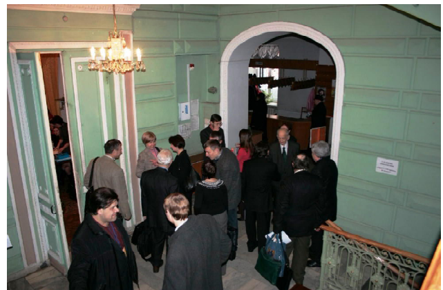
Київський будинок учених (спілкування колег)

Слід виділити доповіді учасників конференції, які були присвячені фундаментальним і концептуальним питанням вивчення глобальних природних процесів та еволюції Землі. В цьому блоці були представлені роботи з глибинного дослідження земної кори і верхньої мантії, па-