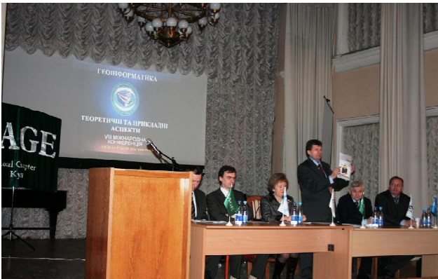
Відкриття конференції (Великий конференц-зал Київського будинку вчених)

На офіційне відкриття конференції зібралося понад 180 учасників з понад 33 організацій, що представляли вітчизняну академічну, освітню і галузеву науку, а також виробничих структур різних форм власності. Підтримали конференцію і стали її учасниками вчені Російської Академії наук, профільних російських вищих навчальних закладів та громадських об’єднань. Приємною для організаторів була увага до цієї події в Україні з боку міжнародних організацій і присутність представника Європейської асоціації вчених та інженерів-геологів і геофізиків.