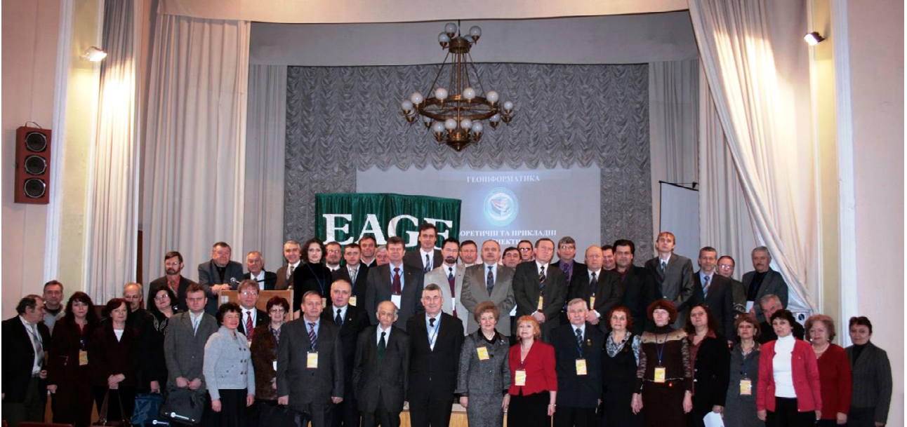
Учасники конференції (24 березня 2009 р.)

Уже другий рік поспіль Будинок учених Національної академії наук України гостинно відкриває свої двері учасникам конференції з геоінформатики, яка щорічно, починаючи з 2002 р., проводиться наприкінці березня у Києві. Для організації VIII Міжнародної конференції “Геоінформатика: теоретичні та прикладні аспекти” (24–27 березня 2009 р.) свої організаторські, ділові та фінансові ресурси об’єднали Центр менеджменту та маркетингу в галузі наук про Землю Інституту геологічних наук НАН України; Всеукраїнська асоціація геоінформатики; Інститут прикладних проблем екології, геофізики та геохімії; товариство “Карбон-ЛТД”; Європейська асоціація вчених