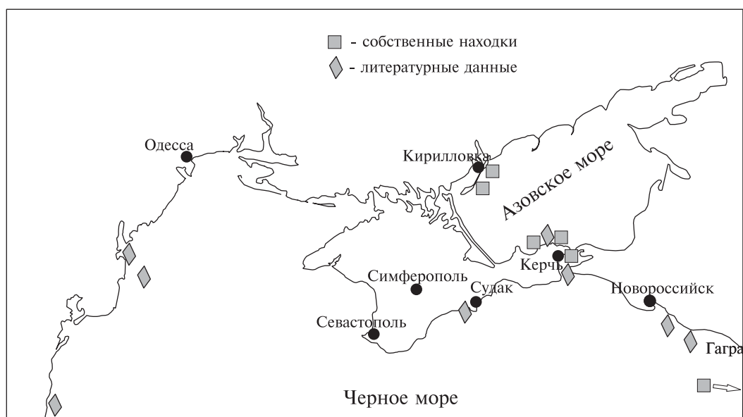
Рис. 2. Проникновение и расселение моллюска A. inaequalvis в Черном и Азовском морях.

Fig. 2. Penetration and colonizing of A. inaequalvis in the Black and Azov seas.