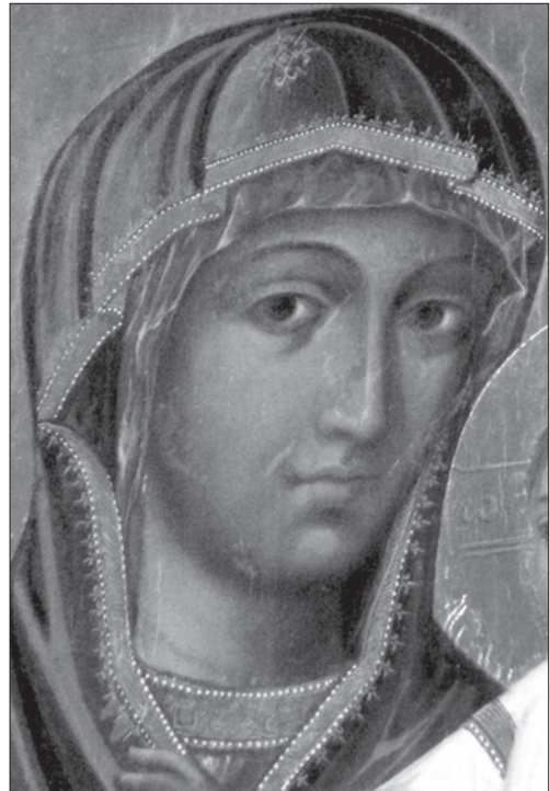
Іл. 5. Фрагмент ікони з м. Буська Львівської обл.

гаємо яскраво виражену однотипність основних авторських ознак ікон. Особливо зближеними є фрагменти монастирської і буської ікон. Найперше зауважуємо образну однотипність погляду Богородиці, створеного авторським розміщенням і пропорціями основних деталей лику та м'яким світлотіньовим прописуванням — охрінням. Порівнюючи форму прорізу очей, розміщення і форму перенісся, носа, уст — спостерігаємо авторську наближеність. Ідентично проходить у трьох іконах середня лінія та кутики уст, прописи підборіддя, овал лиця. Графіка драперій мафорію перегукується в іконах з Ріпнева і з Буська. Зображення оздоблюючої облямівки мафорію у трьох іконах вирішено однаково. На жаль рентгенограма монастирської ікони не подає чіткої графіки складок мафорію Богородиці. Припускаємо, що ми бачимо запис пізнішого часу, оскільки перше зображення з певних причин не збереглося. В даному випадку мафорій лягає м'якше, з більшою схильністю до натуралізму у відображенні.