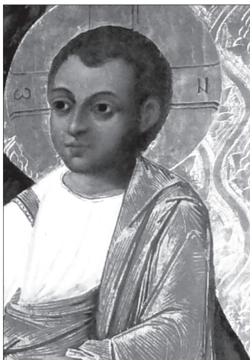
Іл. 7. Фрагмент ікони з м. Буська Львівської обл.