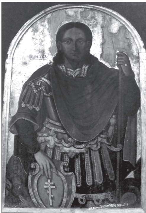
Іл. 3. Ікона Св. Муч. Юрія (знаходиться в ЛНМ ім. А. Шептицького)