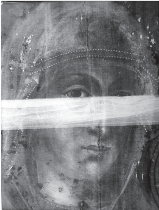
Іл. 4. Фрагмент ікони з Львівського монастиря сестер ЧСВВ (відбитка рентгенівського знімка)