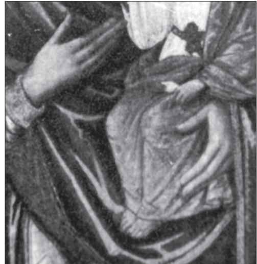
Іл. 11. Фрагмент неіснуючої ікони з с. Ріпнів Буського р-ну Львівської обл.

Фрагментарне порівняння основних моментів авторського почерку трьох згаданих ікон підводять до висновку, що вони створені тим самим малярем у невеликому проміжку часу. Тобто автору ріпнівської ікони, що залишив підпис — «ВО ЛЬВОВІ Р.Б. АФЧО (1599) ФЕДОР» [26, с. 346] належать ще дві вперше досліджувані ікони Богородиці Одигітрії: з м. Буська Львівської області, та з монастир-