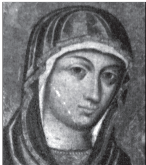
Іл. 6. Фрагмент неіснуючої ікони з с. Ріпнів Буського р-ну Львівської обл.

Цікавим моментом для порівняння є поясне зображення Дитяти Христа на трьох іконах — буській (Іл. 7), ріпнівській (Іл. 8) і монастирській (Іл. 9). На нашу думку, цей фрагмент ще яскравіше вказує, що всі три ікони належать одному майстру.