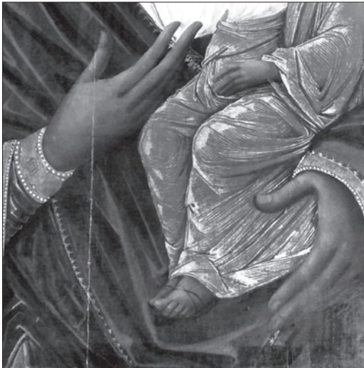
Іл. 10. Фрагмент ікони з м. Буська Львівської обл.

середній пальці складені разом, а в монастирській іконі вони — на відстані. Щоправда, зображена на рентгенограмі рука Богородиці пластикою світлотіннювого вирішення злегка вказує на високо-професійні зразки кінця XVI століття.