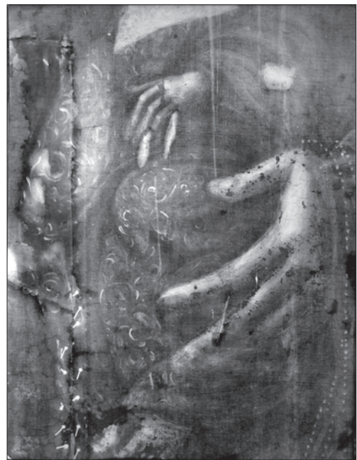
Іл. 12. Фрагмент ікони з Львівського монастиря сестер ЧСВВ (відбитка рентгеновського знімка)

ської каплиці Сестер Василянок у Львові, що належала до іконостасу собору Святого Юра у Львові.