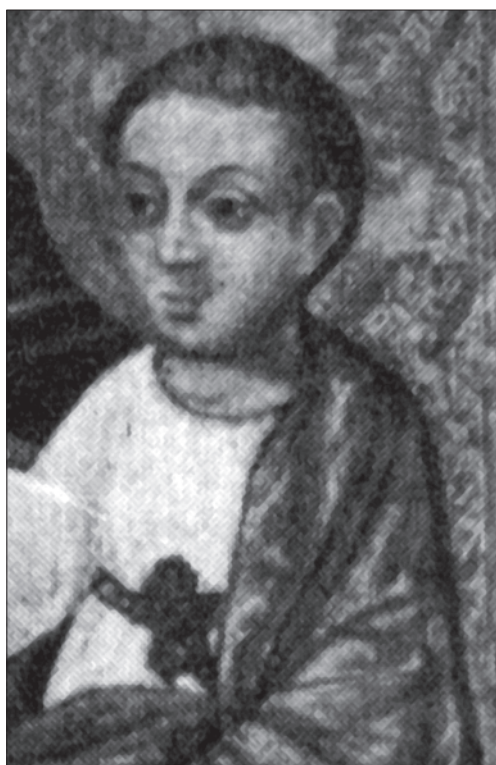
Іл. 8. Фрагмент неіснуючої ікони з с. Ріпнів Буського р-ну Львівської обл.

льовані рукою одного майстра, вправленого в авторських пропорціях. Спостерігаємо певні іконографічні розбіжності в розміщенні гіматія в зображенні Дитяти Ісуса. На ріпнівській і монастирській