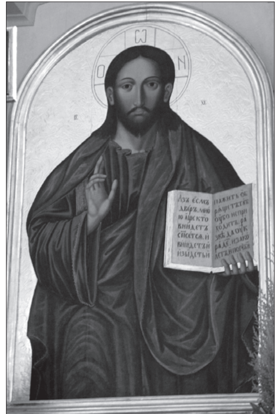
Іл. 2. Ікона Спаса з ц. Івана Богослова в с. Зимна Вода біля Львова