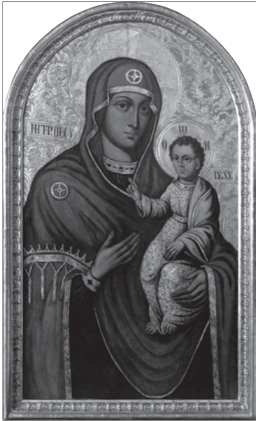
Іл. 1. Ікона Богородиці Одиґітрії з монастиря сестер ЧСВВ у Львові