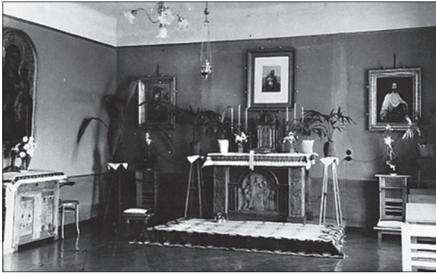
Лл. 13. Вигляд відновленої в 1936 році каплиці при промисловій школі сестер Василянок на вул. Длугуша, 17 у Львові