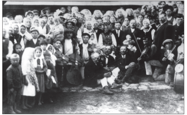
Весілля в Завадці Романівській

Ще коли батько о. Михайло Жеплинський був парохом в с. Завадка на Лемківщині, мені виповнило-