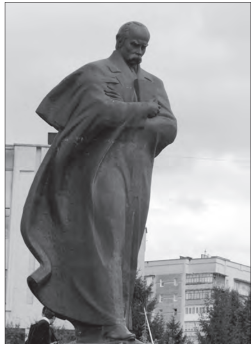
Іл. 8. Василь Одрехівський, Володимир Одрехівський, «Тарас Шевченко», бронза, граніт, м. Новий Розділ, 1997

Постать Тараса Шевченка передано в складному динамічному стані (іл. 8), коли фігура, на перший погляд, перебуває, немов у стані спокою, хоча насправді це є початок руху. Тут поєднані і статика, і динаміка. Авторам вдалося уникнути як застигlosti, так і надмірного вияву зовнішнього руху. Виразний порив фігури стримується станом внутрішньої зосередженості, в якому перебуває поет. Його обличчя сповнено роздумів, внутрішньо зосереджене. Контрастом до цільної монолітної фігури є складки плаща-накидки,