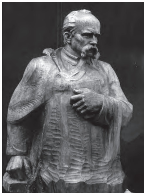
Іл. 10. Василь Одрехівський, «Тарас Шевченко», дерево, 1990-ті рр.

Створюючи пам'ятники діячам української культури, В. Одрехівський майстерно вибудовує конструктивну, змістовну пластичну форму, знаходить