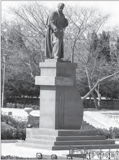
Іл. 6. Василь Одрехівський, Володимир Одрехівський, «Тарас Шевченко», бронза, граніт, м. Севастополь, Крим, 1994 (встановлено 2003 р.)