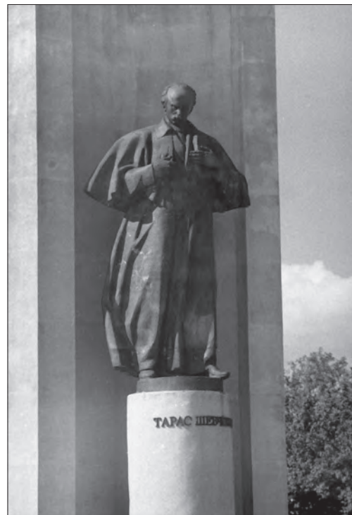
Іл. 3. Василь Одрехівський, Володимир Одрехівський, Тарас Шевченко (фрагмент монумента «Будителі»), бронза, камінь, м. Стрий, 1995

образ, в якому зберігає специфічну для портрета багатогранність характеристики, неоднозначність образу. Таким чином, від станковізму взяті не зовнішні прийоми, а його глибинні особливості, його здатність до багатостороннього, глибокого, психологічного розкриття образу.