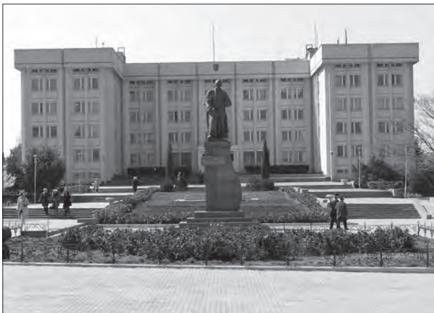
Іл. 7. Василь Одрехівський, Володимир Одрехівський, «Тарас Шевченко», бронза, граніт, м. Севастополь, Крим, 1994 (встановлено 2003 р.)

і славу, а дзвін над об'єднаними арками — це символ заклик до єдності, до пробудження, до активного громадського життя.