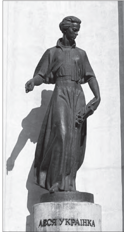
Іл. 5. Василь Одрехівський, Володимир Одрехівський, Леся Українка (фрагмент монумента «Будителі»), бронза, камінь, м. Стрий, 1995

Образ Івана Франка (іл. 4) побудований за принципом стійкого балансу фігури, що стоїть. Характер руху скульптури більше підкреслили динамізм та активність натури Івана Франка, його рішучість та не-