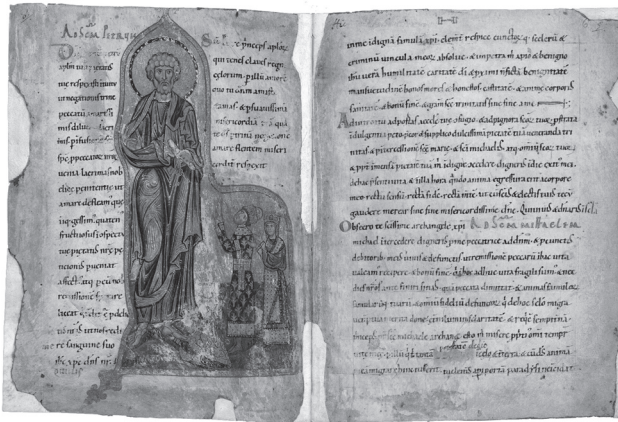
Псалтир Егберта, арк. 5v—6r

доповнень. Причому автор першої, будучи художником візантійського вишколу, імітував західні іконографічні зразки, а другий, навпаки, будучи західного походження, послуговувався візантійськими моделями. Щодо місця виконання, то окрім традиційних версій про Київ і волинські міста, в яких правив Ярополк, Е.С. Смирнова вказує на Туров, який також входив до Ярополкових володінь. Датування відповідно визначається на час правління Ярополка в цих містах, тобто між 1078 (роком смерті його батька Ізяслава) та 1085 (роком вигнання Ярополка і переїзду Гертруди до Києва). Символічне значення композицій Е.С. Смирнова інтерпретує у тісному зв'язку з іншими Гертрудиними доповненнями. Так, перша мініатюра (арк. 5v), на думку дослідниці, є візуалізацією молитов до апостола Петра, написаних обабіч зображення, а мініатюра на арк. 10v, яка зображає коронацію Ярополка, об'єднується в мініцикл з двома іншими, що їй передують (арк. 9v та 10r відповідно). Ці дві мініатюри, репрезентуючи Різдво Христове та Розп'яття, символізують початок і кінець Євангельської історії, а мініатюра з коронацією, оскільки містить образ Христа у Славі, відсилає до теми Старшого суда. Таким чином, виникає цикл, який оповідає про земний шлях Христа, Його жертву та спасіння, що гряде.