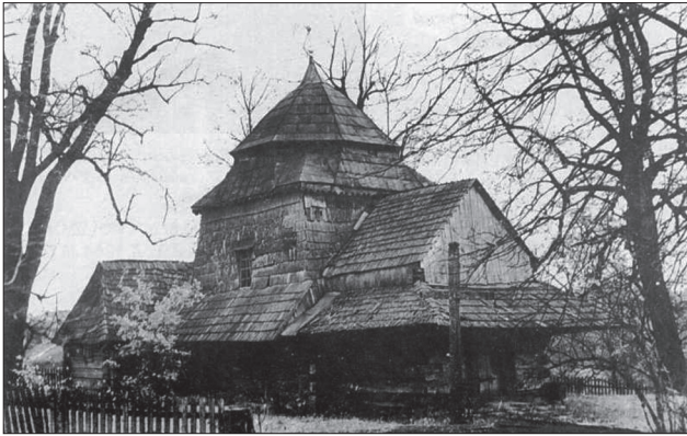
Церква Преображення Господнього у с. Вороблячин Яворівського р-ну Львівської обл. Побудована 1662 р. За репродукцією у: [12, с. 395—396]

них візитацій XVIII ст., де доволі часто можна натрапити на згадку про страсті Господні «на полотні мальовані» або «на картині полотняній мальовані» [16, с. 217—218, 220—221; 8, с. 68—79]. Напевно, у дерев'яних храмах такі Страсті стали доволі вдалою альтернативою стінопису. Такий спосіб виконання забезпечував від руйнації зображення при тріщинах та зсуві деревини на стику, яку часто мав стінопис. Полотна з мальованими композиціями набивали на стіну, ймовірно, окантовували планками. Могли також вивішувати на підрамнику. Деякі багатосюжетні ікони страстей на полотні XVII—XVIII ст. складаються з окремих (переважно трьох чи п'яти) частин, кожна з яких опрацьована на підрамник. Зрештою, при потребі полотно можна було перевісити в інше місце у храмі. Якщо опиратися на матеріали церковних візитацій, то у XVIII ст. (очевидно і в XVII ст.) Страсті Господні, мальовані на полотні за давньою середньовічною традицією, найчастіше розташовувалися у наві на південній або північній стіні, переважно навпроти Страшного суду, який, як свідчать матеріали візитацій, був частіше мальований на дошці. Також можна знайти згадки, що старі Страсті Господні були й у притворі (бабинці) церкви.