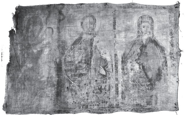
«Богородиця Одигітрія, Христос, св. Антоній». Кінець 1680 — 1690-ті рр. З церкви Преображення Господнього с. Вороблячин Яворівського р-ну Львівської обл. Полотно, темпера. НМЛ

Інша ікона на полотні з церкви у Вороблячині має образ Богородиці Одигітрії, Христа Пантократора та св. Антонія. Усі фігури зображені фронтально до колін на світлому тлі заґрунтованого полотна, їх розділяє мальована брунатна смуга. Іконографія традиційна, однак бачимо деякі західноєвропейські деталі. Це сфера в руці у Христа та вервиця у св. Антонія. З вервицею преподобні Антоній та Теодосій Печерські зображувалися в гравюрах українських стародруків від середини XVII ст., і також інколи на цокольних іконах іконостасів. На іконі з Вороблячина не можна однозначно сказати, чи зображено св. Антонія Печерського, чи Антонія Великого, оскільки їхня іконографія подібна, а на іконі підписи втрачені через осипи фарбового шару. Преподобний у чорній рясі, клобучі великосхимника та у темному вохристовому парамані з невеликими хрестами. У правій руці святого — великий дво- або трираменний світлий хрест (знищений у верхній частині). Таке зіставлення постатей на полотні також не має аналогів в інших творах. Якщо допустити, що на іконі зображено Антонія Печерського, то знову простежується зв'язок із княжою київською традицією. Зважаючи на іконографію, припускаємо, що ікона розташовувалася на стіні нави церкви. Тут можна привести для порівняння певну довільність у розташуванні сюжетів у стінописі 1620-х рр. церкви Святого Духа сусіднього с. Потелич, де бачимо на стінах нави багатосюжетні Страсті Господні, сцену Успіння Богородиці, Пентаморфон з Моління, пророків, образ