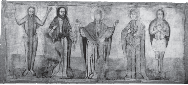
«Богородиця Оранта зі святими Іваном Сучавським, Параскевою, Онуфрієм та Марією Єгипетською». Кінець 1680 — 1690-ті рр. З церкви Преображення Господнього с. Вороблячина Яворівського р-ну Львівської обл. Полотно, темпера. НМЛ

Христос (фігура Христа не збережена). Ймовірно, сюжет представляє усікновення вуха та зцілення слуги первосвященника, за євангельською оповіддю ця подія передєє у в'язненню Христа. Епізод з ап. Петром на іконах часто виступає не як окреме клеймо, а разом із сценою Поцілунку Юди. На полотні з Вороблячина це клеймо замикає загальну композицію, що свідчить про фрагментарне збереження полотнища.