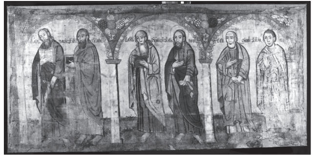
Права частина Апостольського Моління. Кінець 1680 — 1690-ті рр. З церкви Преображення Господнього с. Вороблячин Яворівського р-ну Львівської обл. Полотно, темпера. НМЛ

У сцені Пилат умиває руки Христос зображений на західноєвропейський манер справа композиції, у супроводі воїнів, а Пилат сидить у маньєристичному ракурсі, звернений вліво, вмиваючи руки, однак торс і голова його повернуті до Спаса. Одяг Пилата, трон з вигнутими ніжками також має ознаки західноєвропейської моди. Нижня ліва сцена Бичування Христа у нижній частині повністю втрачена, однак чітко прочитується верх фігури Христа, який зображений оголеним у лівій частині композиції, стоячи біля колони. Його лик звернутий вправо, руки зав'язані попереду. Навпроти Спаса менший масштабно воїн замахується піднятими різками, нижче намальований ще один воїн з різками. Центральна сцена Розп'яття Христове з двома розбійниками також збережена лише у верхній частині. Тут виділяються три високі хрести. Христос розп'ятий на однораменному вохристо-цеглястому хресті, його поперечина майже сягає завершення композиції, поверх виступає коротке деревко, таким чином хрест Спаса нагадує Т-подібний латинський взірєць. Лик Христа майже повністю втрачений однак прочитується великий терновий вінок на голові та світло вохристий німб. Варто відзначити, що руки Спаса сильно дугоподібно провисають, імітуючи західноєвропейські взірці Розп'яття. Торс