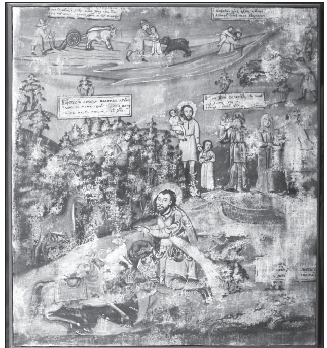
Ікона «Св. Євстахій в житті». 1685 р. З церкви св. Юрія с. Гринові Пустомитівського р-ну Львівської обл. Полотно, темпера. НМЛ

тті» з Гринова, яку приписуємо цьому ж автору, що також вказує на час його творчої діяльності. Окрім того на іконі Покрову Богородиці з Лопушанки Лехнової, яку також приписуємо майстрові є обширний вкладний текст у якому зазначено, що вона створена за «православного єпископа Інокентія Винницького». Як відомо, Інокентій (Іван) Винницький став єпископом 1680 р., а 1691 р. офіційно перевів Перемиську єпархію на унію з Римською церквою. Таким чином час створення згаданих намісних ікон з Лопушанки Лехнової припадає на 1680—1691 рр. [7, с. 107—118]. Відповідно у межах 1685—1690-х рр. пропонуємо датувати полотна з Вороблячина, що підтверджується також стилістикою їх малярства. До почерку автора полотен з Вороблячина близькою є стилістика малярства риботицького майстра Якова, що відомий за низкою ікон до церков Святкова Мала, Святкова Велика, Котань та Дешниця на Лемківщині. Час праці цього маляра за датованими творами припадає на 1673—1694 рр. На найраніших пределах 1673 р. у церкві Святкової Малої він себе окреслив як «Ліський» [7, с. 107—118], на пізніших творах — іконах 1689—1691-х рр. з іконостаса церкви в Котаню (Музей-Замок у Ланцуті) та вівтарі 1694 р., що в церкві в Дешниці як «Риботицький». Подібність почерків обох майстрів дає підставу ви-