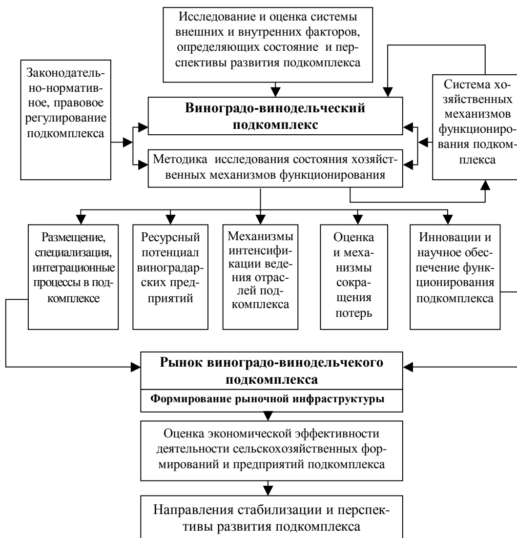
Рис. 2. Структурно-составляющие элементы виноградо-винодельческого подкомплекса [1;9]

Структурно -составляющие элементы виноградо-винодельческого подкомплекса, по-нашему мнению, можно представить следующим образом (рис. 2).