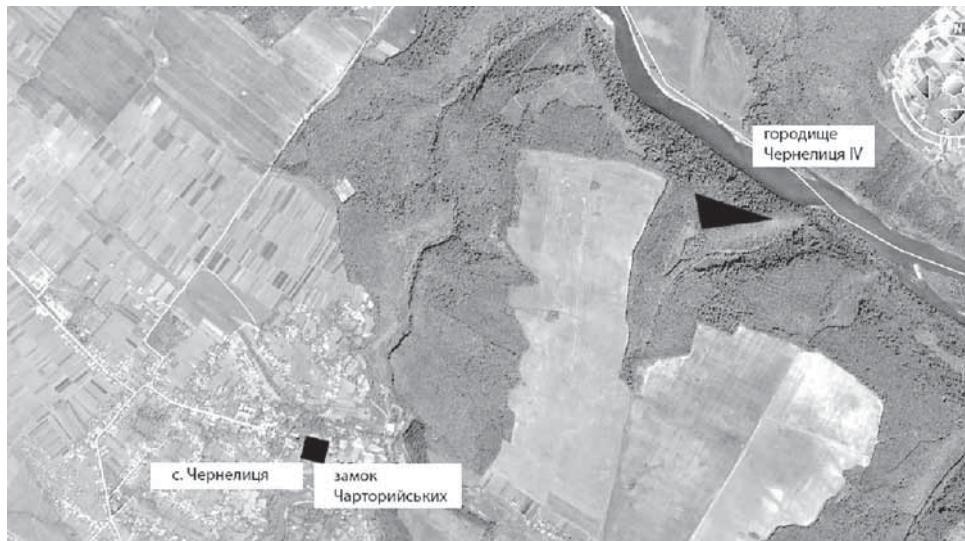
Городище Чернелиця IV. Ситуаційна схема