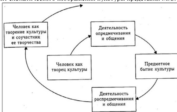
Рис. 2. «Круг культуры» М.С. Кагана.

Более сложный вариант схематического изображения культуры представил М.С. Каган: