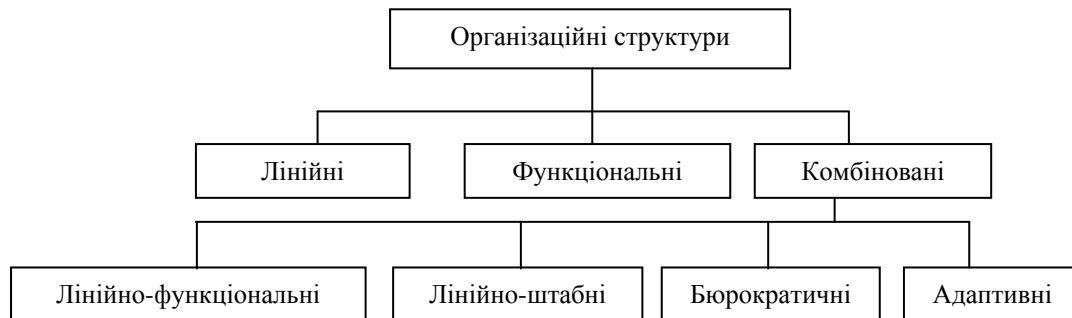
Рис. 3. Основні типи організаційних структур управління підприємством

Лінійна структура управління підприємством (рис. 4) базується на зосередженні всіх виробничих та управлінських функцій у керівника. Тут усі повноваження є прямими (лінійними), вони спрямовані від вищої ланки управління до нижчої. Лінійна структура управління вимагає високої компетенції керівника з усіх питань. Таку структуру управління можна використовувати тоді, коли система організації є простою та має сталі умови функціонування, тобто на малих підприємствах або на початку зародження [1].