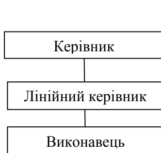
Рис. 4. Лінійна структура управління підприємством

Основа лінійно-функціональних структур складає так званий «шахтний» принцип побудови і спеціалізація управлінського процесу по функціональних підсистемах організації (маркетинг, виробництво, дослідження і розробки, фінанси, персонал та ін.). По кожній з них формується ієрархія служб. Результати роботи кожної служби апарату управління організацією оцінюються показниками, що характеризують виконання ними своєї мети і завдання [3]. Схему лінійно-функціональної структури наведено на рис. 5.