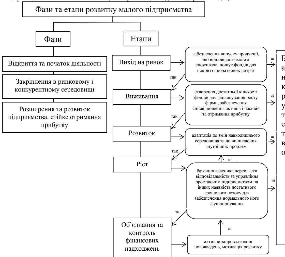
Рис. 1. Фази та етапи розвитку малого підприємства

На нашу думку, найбільш влучно визначили це поняття дослідники Вільгуцька Р.Б. та Георгіаді Н.Г. Вони зазначили, що під організаційною структурою управління підприємством слід розуміти систему, яка демонструє сукупність взаємозв'язків і взаємопідпорядкування між посадовими особами і структурними підрозділами підприємства, відображає рівні управління, розподіл повноважень та відповідальності між ними і сприяє досягненню поставлених цілей і реалізації завдань підприємства [2].