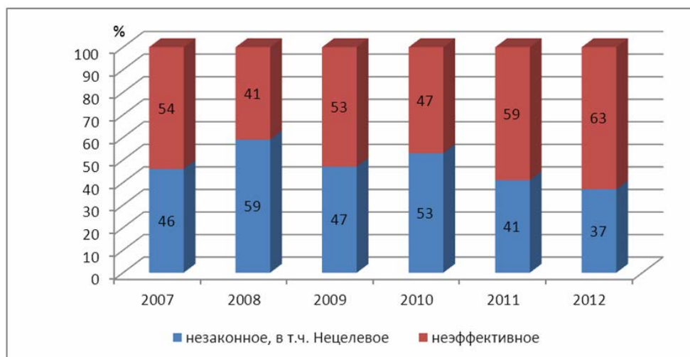
Рис. 2. Соотношение незаконного и неэффективного использования бюджетных средств