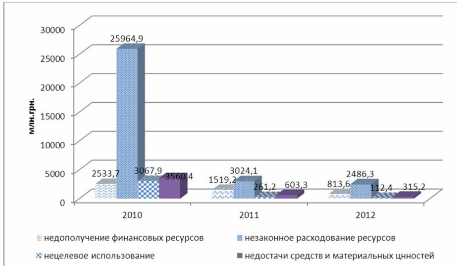
Рис. 3. Динамика выявленных нарушений в 2010 – 2012гг.