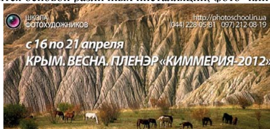
Илл. 3. Реклама фото-пленэра «Киммерия-2012» [4].

Стоит отметить и то, что в XXI в. пленэрная живопись в её традиционной форме – поход художника «на этюды» – вынуждена конкурировать со ставшим весьма популярным среди разных слоёв населения фотоискусством (илл. 3). Сейчас результатом работы на открытом воздухе не обязательно будет «портрет природы с натуры». Часто живопись оказывается лишь формальным атрибутом пленэров, а впечатления, полученные на пленэре, становятся основой различных инсталляций, фото- или видео-проектов.