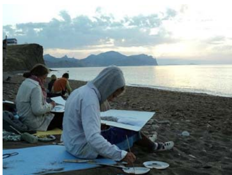
Илл. 2. Морской пленэр в Феодосии (2009) [8].

Но чаще всего на «дикие» пленэры выезжают либо в компании знакомых между собой людей, либо в одиночку. Организация таких пленэров является в большей степени хаотичной. Творческому человеку присуще действовать в порыве идеи, а мысль о поездке к морю «порисовать и вина попить под звёздами» приходит неожиданно и либо угасает, либо всё-таки реализуется с весьма интересными результатами. Удачный выбор места, времени и соответствующей компании может вдохновить художника на совершенно неожиданные проекты.