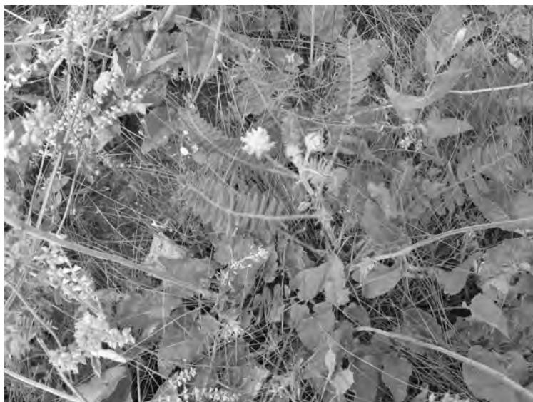
Рис. 2. Astragalus dasyanthus Pall. в стані цвітіння (Балка Стрітенська, Волноваський район, Донецька область, червень 2008)

Спостереження показали, що на сьогодні (червень, 2008 рік) на дослідних ділянках збереглися одиничні екземпляри в верхній частині схилу балки. Проте генеративні особини цвітуть і мають міцні вегетативні пагони (рис. 2). Показники біометричних параметрів генеративних особин близькі до значень відповідних параметрів особин інтродукційної популяції ДБС.