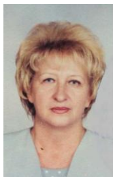
Ответственный исполнитель: кандидат географических наук, доцент Карташевская И.Ф.