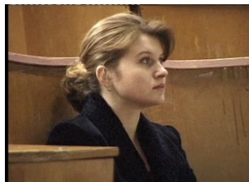
Исполнитель: ассистент Остроухова Л.В.