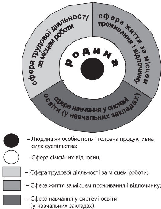
Рис. 1. Квадра сфер життєдіяльності людини, де вона має потребу самореалізуватися

Перший (залежно від особистих вимог може бути і другим) – це достатня матеріальна винагорода за працю з метою задоволення фізіологічних та інших потреб.