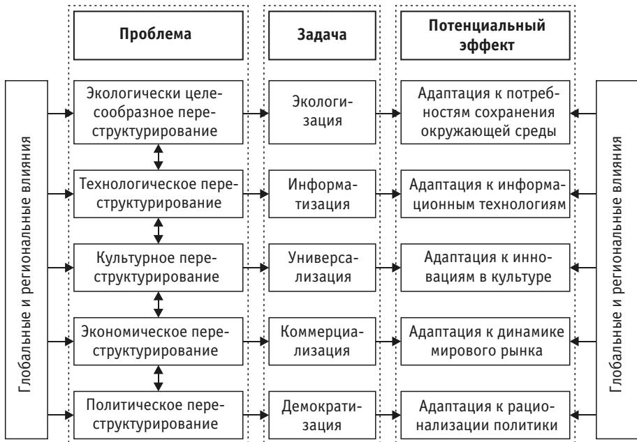
Схема 1. Структурные измерения социетальных трансформаций в Восточной Европе

Взаимосвязанные решения этих задач осуществлялись на национальном уровне не без влияния глобальных и региональных процессов (схема 1).