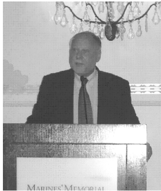
Лауреат Премії Міда 2009 року Джозеф Котарба

теорії соціального часу Евіатар Зерубавель 1 . Виступ викликав жвавий інтерес і дискусії, а слідом за цим розпочалася урочиста вечерея, під час якої було вручено щорічні премії та підбито підсумки роботи товариства за минулий період. Головну премію імені Джорджа Герберта Міда за видатний внесок у розвиток символічного інтеракціонізму було вручено цього року Джозефові Котарбі із Г'юстонського університету. Мій співавтор Дж.Джонсон був визнаний гідним премії “Mentor Award” за видатні досягнення в підготовці майбутнього покоління соціологів. Також була вручена премія імені Чарльза Гортон Кулі за кращу публікацію року в традиції символічного інтеракціонізму (книга Каролін Еліс “Погляд назад: автоетнографічні роздуми про життя і роботу”) і премія імені Герберта Блумера за кращу працю серед аспірантів (стаття Раймонда Гарет-Пітерса “Якщо мені не потрібно більше працювати, хто тоді я?”).