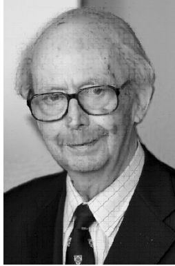
У червні 2009 року пішов із життя Ральф Дарендорф

ний рух”, “Расові й етнічні меншини”, “Раса, гендер і клас”, “Політична соціологія”, “Економічна соціологія”, “Викладання і навчання соціології”. У решті секцій налічується від 176 (секція “Тварини і суспільство”) до 730 членів (секція “Порівняльно-історичної соціології”), а в середньому цей показник коливається в межах 450 осіб. До новітніх груп за інтересами, що мають статус “на стадії формування”, належать секції “Права людини”, “Інвалідність і суспільство”, “Альтруїзм і соціальна солідарність” та “Соціологія тіла”. Нехай це не професійна оцінка, але гадаю, що за рівнем розвитку тих чи тих секцій можна судити про найактуальніші сфери, проблеми й тенденції розвитку американської соціології загалом.