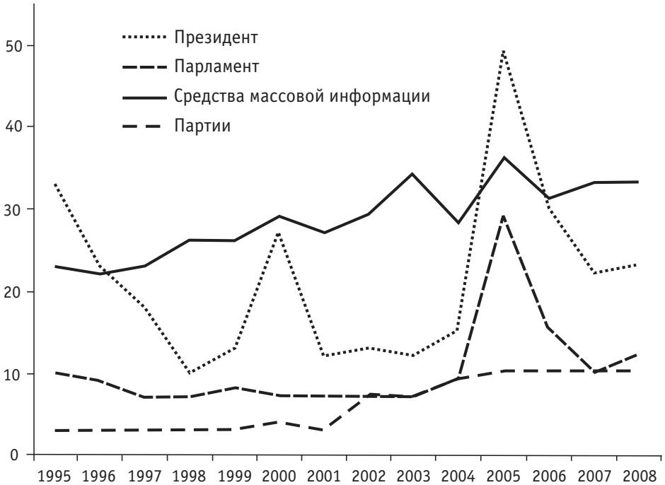
Рис. 1. Доверие к институтам, 1995–2008 годы