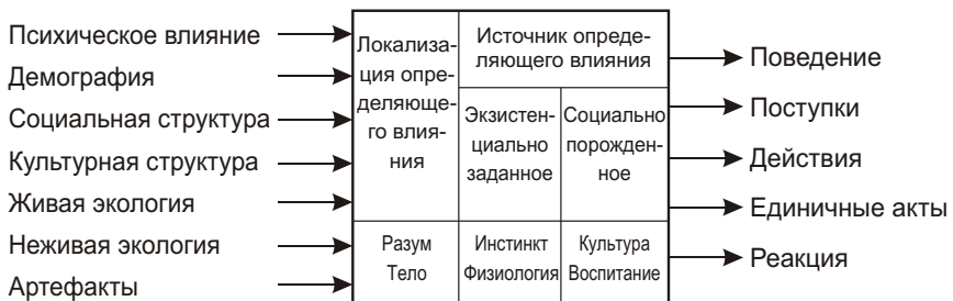
Рис.2. Структурная схема активности человеческого индивида (модель типа “белый/прозрачный ящик”)