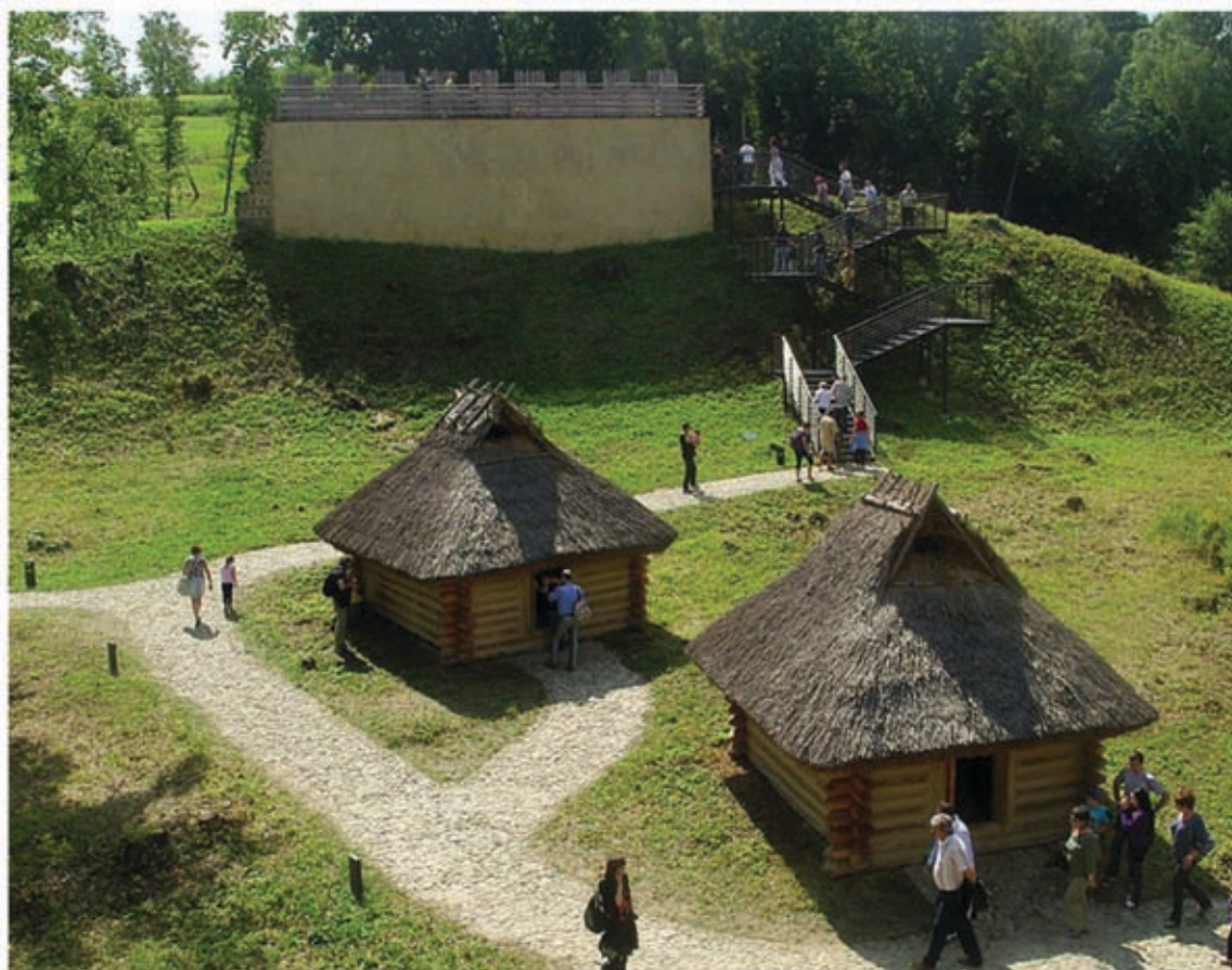
Рис. 4. Споруди музею під відкритим небом в Тржиниці