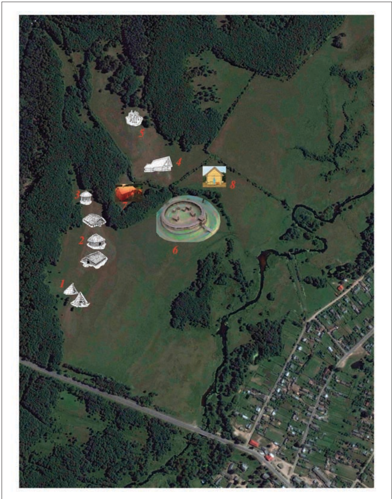
Мал. 2. Праект будучага «Археалагічнага музея пад адкрытым небам» каля в. Камянюкі на тэрыторыі НП «Белавежская пушча»: 1 — тэрыторыя для рэканструкцыі пабудовы эпохі мезаліту; 2 — тэрыторыя паселішча Камянюкі 3 для рэканструкцыі вёскі бронзавага веку; 3, 5 — месца для аднаўлення першабытных культурных пабудов; 4 — тэрыторыя паселішча Камянюкі 2 для рэканструкцыі вёскі эпохі позняга неаліту; 6 — тэрыторыя паселішча Камянюкі 1 для аднаўлення гарадзішча жалезнага веку; 7 — месцаразмяшчэнне будучага падворка жалезнага веку (пшэворскай культуры); 8 — месца для рэканструкцыі жылой пабудовы ранніх славян