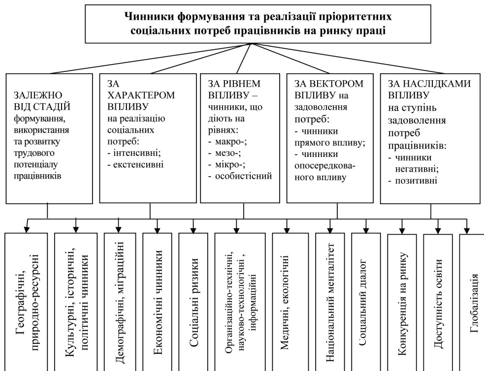
Рис. 1. Класифікація чинників, що впливають на формування та реалізацію пріоритетних соціальних потреб працівників на ринку праці

Зміну пріоритетних соціальних потреб працівників обумовлюють зміни у матеріальному добробуті, стані соціальної захищеності, умовах праці, духовних цінностях тощо. Зауважимо, що процес формування та реалізації пріоритетних соціальних потреб працівників є дуже складним, він відбувається під впливом багатьох чинників (рис.1).