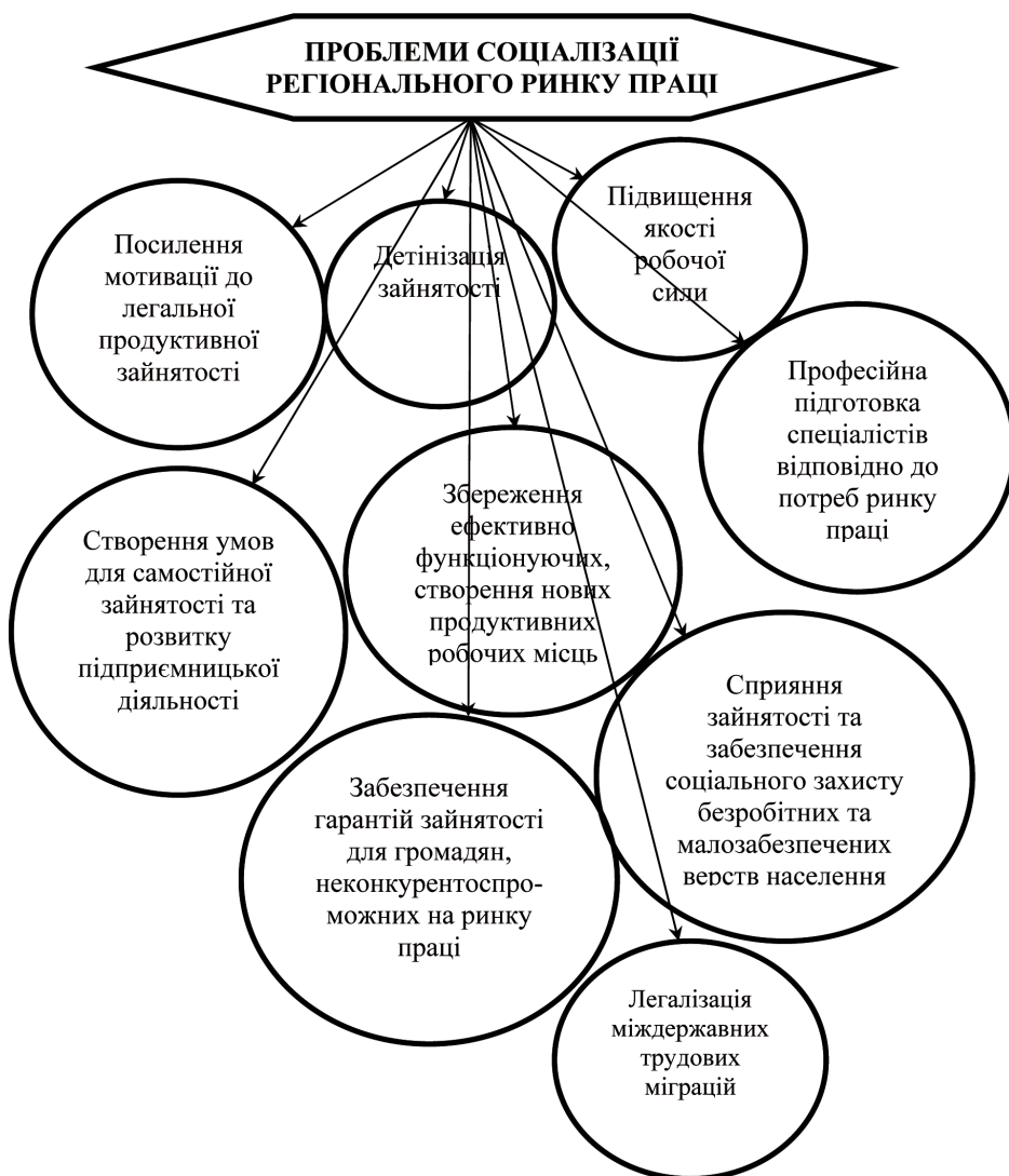
Рис. 2. Проблеми соціалізації ринку праці, які залишаються невирішеними

праці нижче або на рівні прожиткового мінімуму. Понад 1/3 працюючих в області у 2006 р. отримували заробітну плату у розмірі до 600 грн., чого не вистачало на повноцінне харчування одного працівника, не кажучи про сім'ю, сплату комунальних послуг, житла тощо. 41,3% працівників отримували заробіток від 600 до 1250 грн., що забезпечувало пріоритетні потреби на рівні фізичного виживання, проте такий заробіток не створював матеріальних можливостей для лікування, оздоровлення, постійного освітньо-професійного розвитку за власні кошти, не говорячи про придбання житла або навіть погашення довгострокового кредиту на житло [7].