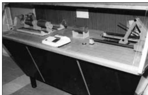
Рис. 3. Макеты роботизированного комплекса по транспортировке и сварке обечаяк

Considered are the processes of simulation and modeling of the method and technology for the fabrication of welded structures under the training process conditions. Described are some laboratory works in speciality «Fabrication of Welded Structures».