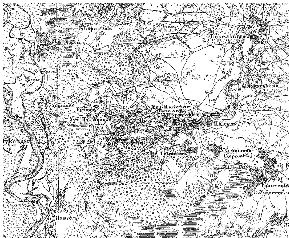
Географічна карта XIX століття

– У нашому селі панів не було, – згадували старожили, – одноосібно було кращим життям.