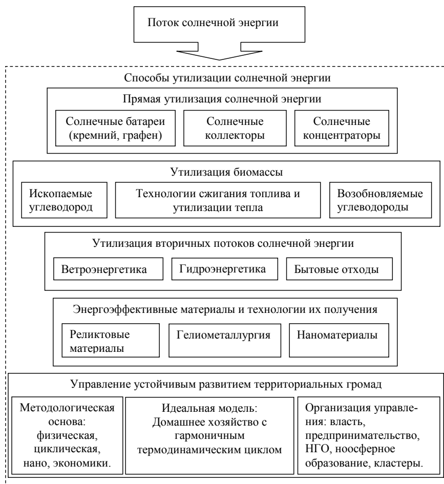
Рис. 4. Поле знаний для формирования профессиональных компетентностей созидателей ноосферы