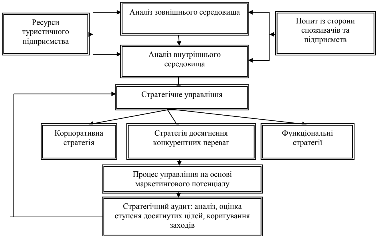
Рис. 2. Структурно - логічна схема досягнення конкурентних переваг підприємством туристичної індустрії в контексті формування економічної безпеки

I етап. Дослідження макросередовища підприємства туристичної індустрії: метод теоретичного узагальнення, прийом SWOT-аналізу і PEST – аналізу.