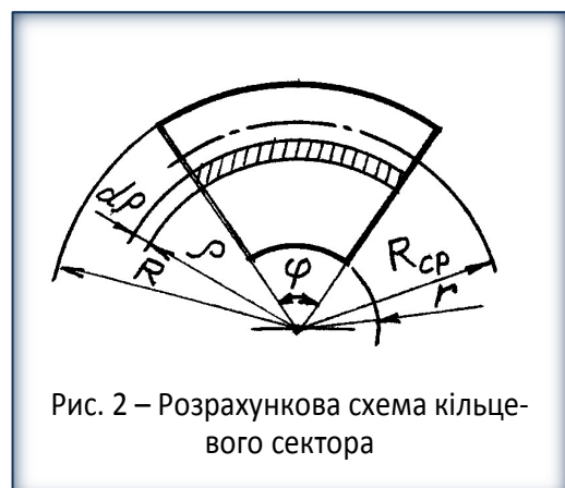
Рис. 2 – Розрахункова схема кільцевого сектора