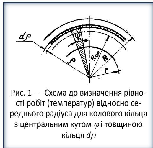
Рис. 1 – Схема до визначення рівності робіт (температур) відносно середнього радіуса для колового кільця з центральним кутом \phi і товщиною кільця d\rho