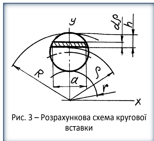
Рис. 3 – Розрахункова схема кругової вставки

Робота сил тертя в межах (R-R_{cp}) і (R_{cp}-r) за