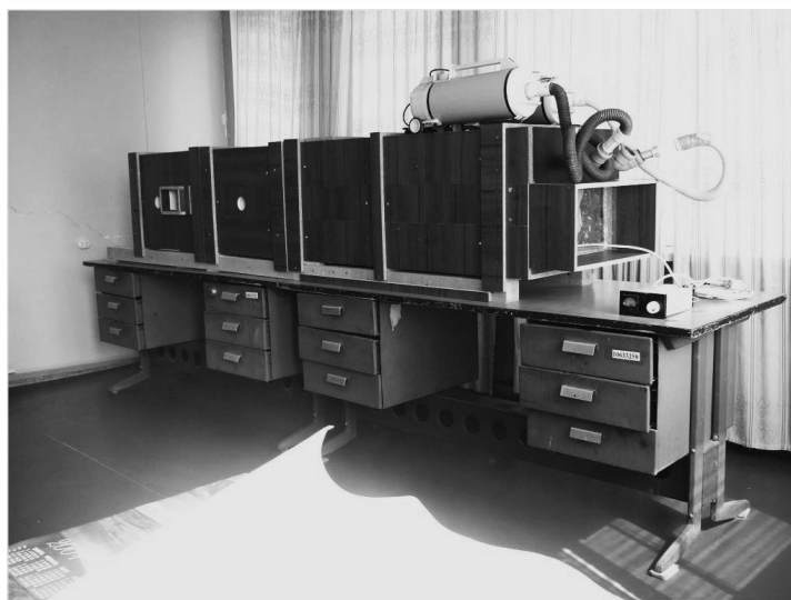
Рис. 2 – Общий вид экспериментальной установки для исследования методов снижения температуры тупиковых подготовительных выработок

При принудительной схеме проветривания с отводом (отсосом) горячего воздуха (рис. 4) эффективность нормализации температуры шахтной атмосферы характеризуется следующими параметрами [11]: