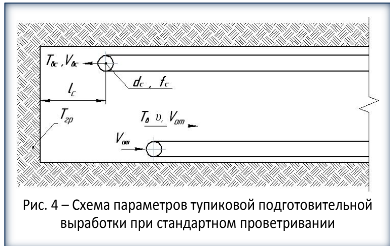
Рис. 4 – Схема параметров тупиковой подготовительной выработки при стандартном проветривании

Чтобы выявить влияние каждого из 10 факторов потребуется большое количество экспериментов, даже если воспользоваться современными методами рационального планирования экспериментов [12]. В связи с этим согласно [13] число исследуемых факторов целесообразно сократить. Это можно сделать, например, исключив из рассмотрения те из них, которые не управляемы с достаточной точностью, например – влажность. А такой параметр, как время – стабилизировать.