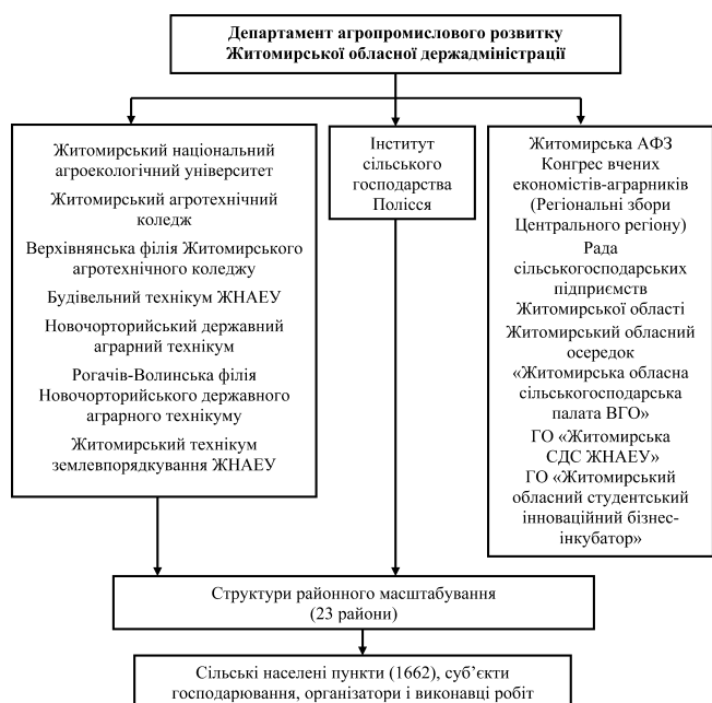
Рис. 2. Організаційна структура Житомирського економічного центру розвитку сільських територій

Важливим питанням розвитку сільськогосподарського виробництва та сільських територій є інформаційне забезпечення, зокрема забезпечення інноваційної діяльності в аграрній сфері. Для цього вкрай необхідно створити мережу центрів як на місцях, так і в Інтернет-мережі. З кожного напрямку інноваційної діяльності доцільно створити інформаційний портал, що інтегруватиме відомості про теоретичні та науково-прикладні досягнення у вибраній сфері, наявні інформаційні ресурси, організації та фахівців, які займаються даною проблематикою, тощо. Наявність такого порталу сприятиме досягненню оперативності інформаційного забезпечення, розвитку відповідних наукових і прикладних напрямів. Економічні центри та сільськогосподарські дорадчі служби повинні містити всю необхідну законодавчу базу зі створення та реалізації інновацій, а також базу інновацій-пропозицій, інформацію про мережу організацій, наукових установ, які займаються розробками. Крім того, доцільним є формування бази суб'єктів, які хотіли б мати доступ до інноваційної продукції, з метою можливості отримання інформації про розробників, виробників необхідної інноваційної продукції і своєчасного використання цієї інформації суб'єктами сільськогосподарської інноваційної діяльності (фермерські господарства, господарські товариства тощо).