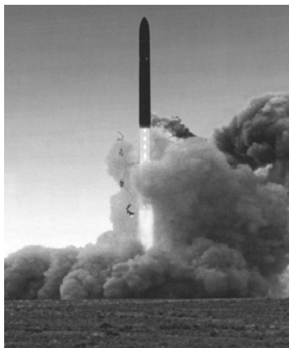
Пуск ракеты 15A18M