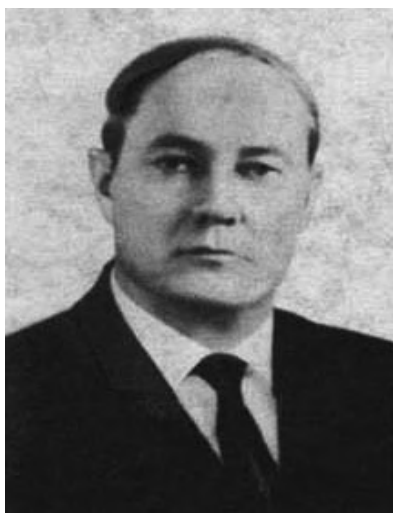
Л. В. Смирнов

Леонид Васильевич Смирнов родился 3 апреля 1916 г. в Кузнецке (ныне Пензенская обл., Россия). Окончил Новочеркасский индустриальный институт (1939) и Промышленную академию Министерства вооружения СССР (1949). В 1949–1951 гг. – директор Центрального научно-исследовательского института автоматики и гидравлики Министерства вооружения СССР, 1951–1952 гг. – начальник Главного управления ракетно-космической техники Министерства вооружения СССР, 1952–1957 гг. – директор Днепропетровского машиностроительного завода № 586, 1957–1961 гг. – начальник Главного управления, 1961–1963 гг. – председатель Государственного комитета Совета Министров СССР по оборонной технике – министр СССР, 1963–1985 гг. – заместитель председателя Совета Министров СССР по оборонным отраслям промышленности, председатель Военно-промышленной комиссии Совета Министров СССР. Умер 21 декабря 2001 г.