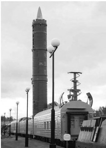
Железнодорожный ракетный комплекс «Молодец»

нципиально новых технических конструкторских решений, в частности в жидкостной двигательной установке боевой ступени и твердотопливных маршевых двигателях первых двух ступеней. Боевой железнодорожный ракетный комплекс с ракетой 15Ж52 представлял собой состав из 17 вагонов и двух тепловозов. 18 января 1984 г. был проведен первый в мире запуск МБР 15Ж52 из железнодорожной пусковой установки, в апреле 1985 г. завершились его ЛКИ, однако комплекс на вооружение принят не был.