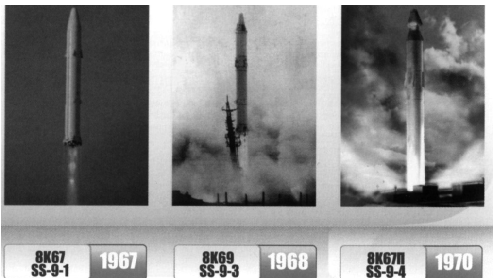
Второе поколение боевых ракет КБ «Южное» [23, с. 7]