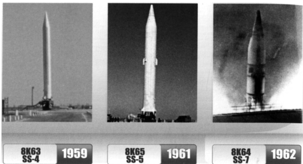
Первое поколение боевых ракет КБ «Южное» [23, с. 7]