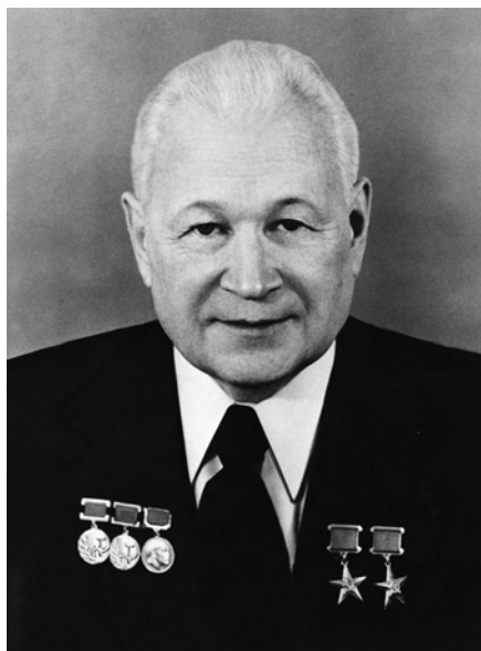
В. Н. Челомей

Потенциальные возможности ракеты Р-36 явились достаточным основанием для начала переговорного процесса об ограничении стратегических вооружений и систем ПРО. СССР выходил на переговоры с США на паритетных началах.