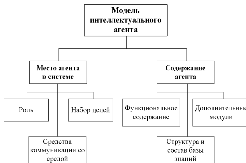
Рисунок 1 – Структура модели интеллектуального агента, входящего в состав интеллектуальной многоагентной системы управления персоналом в условиях удалённого сотрудничества

На рис. 1 показана структура модели интеллектуального агента, входящего в состав интеллектуальной многоагентной системы управления персоналом в условиях удалённого сотрудничества.