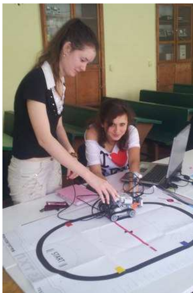
Рисунок 2 – Студенты проводят эксперименты с роботом

Параллельный индикатор существенным образом дополняет и расширяет когнитивные возможности визуализации учебной, исследовательской информации [14]. Изменяемая структура, содержимое окон и акценты на анализ связей между информационными потоками в окнах параллельного индикатора делают процесс обучения более сложным, но и более соответствующим сложности изучаемых объектов и процессов.