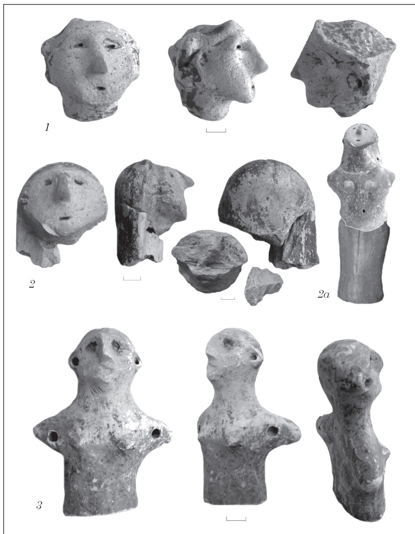
Рис. 3. Статуэтки из поселения Майданецкое

последнее поселение относится к Триполью VII. Фигурка из Ризино близка майданецкой трактовкой прически, напоминающей покрывало (Pogoseva 1985, abb. 709).