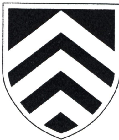
Puc. 2. Плуца 1468 г. Fig. 2. The slab of 1468. Abb. 2. Platte 1468. Dessin 2. Dalle del'an 1468