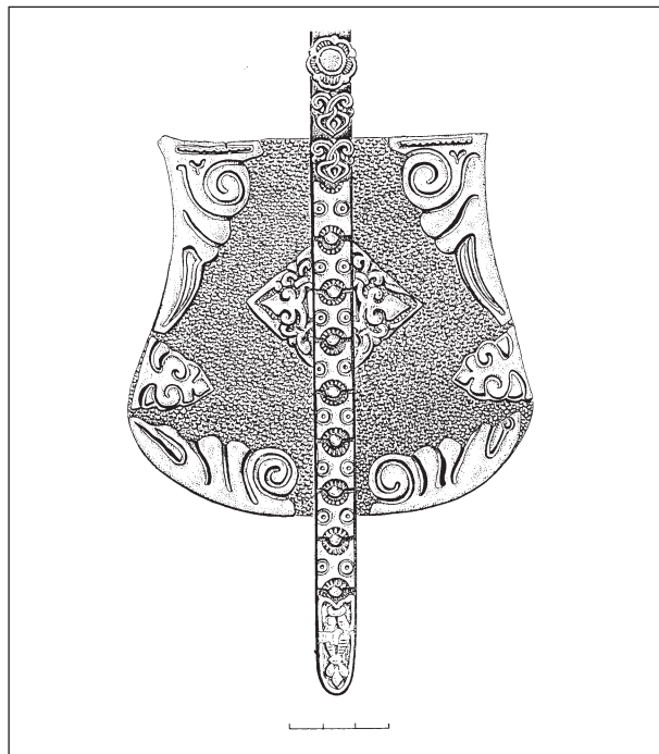
Рис. 2. Сумка-ташка из кургана 42 Шестовиц (по Д.И. Блифельду). Реконструкция Р.С. Орлова

Последние 10—15 лет (до 2010 г.) наблюдается стремительное нарастание разных источников по художественной культуре Руси IX—XI вв. Количественно увеличивается база артефактов в результате новых раскопок, улучшаются способы исследования материалов. Кроме популярных в 60—80-е годы XX в. методов количественных исследований и разного рода статистических обработок, все чаще используется методы технологического исследования вещей, вплоть до технологии производственных процессов и экспериментальных реконструкций (Ениосова, Сарачева 1997; Петраускас 2006). Предметом дискуссий остается структура и организация ремесла и его