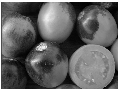
Рис. 2. Селекционная линия № 533-05 F 4 (Барон × Dark Green) ( B , hp-2 dg )