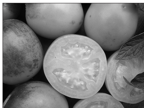
Рис. 3. Селекционная линия № 277-05 F 4 (Барон × Dark Green) ( B , hp-2 dg )

ленной присутствием гена hp-2 dg , по сравнению с его простыми гомозиготами ( hp-2 dg /hp-2 dg ). Это способствовало повышению уровня про-