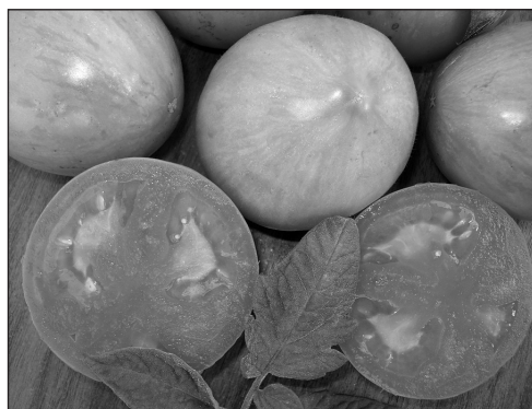
Рис. 5. Красно-оранжевая мякоть плода линии № 377-1/1 06 F 3 {[F 3 (Dark Green × Дружба) × F 4 [(Княжич × Liberator) × Мл-638]} ( B , hp-2 dg , gs , u )

дуктивности таких растений и их скороспелости (продолжительность вегетационного периода от массовых всходов до начала созревания) (табл. 1). Эффект ослабления депрессивного влияния гена hp-2 dg присутствием гена B является достаточно веским фактом, подтверждающим возможность эффективного использования генов повышенной пигментации плода в создании высококароотиновых форм томата. Возможно выявленная особенность имеет связь и с эффектом более быстрого сбраживания семян в пульпе оранжевоплодных (с геном B ) сортов. Так, в исследованиях Смаглий и др. [20] выявлено, что при сбраживании семена оранжевоплодных сортов томата начинают прорастать уже через 8 ч, тогда как у красноплодных форм прорастание начинается лишь через 25 ч. В обоих случаях имеет место сходный эффект ферментативной стимуляции ростовых процес-