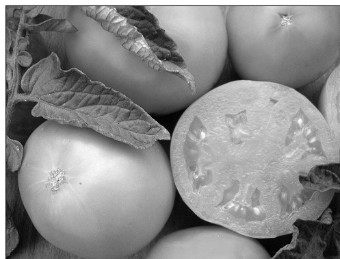
Рис. 4. Оранжево-красная мякоть плода селекционной линии № 279-05 F 4 (Барон × Dark Green) ( B , hp-2 dg )

ленной присутствием гена hp-2 dg , по сравнению с его простыми гомозиготами ( hp-2 dg /hp-2 dg ). Это способствовало повышению уровня про-