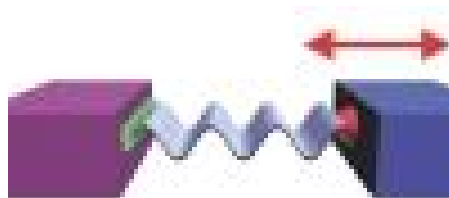
Рисунок 2 – Приемник движется, источник остаётся неподвижным

Как мы можем видеть из этих рассуждений, сдвиг частоты будет разным в зависимости от того, что движется: приемник или источник. Особенно это заметно, если скорость источника или приемника близка к скорости волны. На первый взгляд может показаться, что это противоречит принципу относительности: какая разница что движется – источник или приемник. На самом деле важно не относительное движение приемника и источника, а их движение относительно упругой среды, в которой распространяется волна. При этом скорость распространения волны не зависит от движения источника и приемника. В отличие от акустической волны, для электромагнитной волны явления сдвига частоты протекают совершенно одинаково при движении источника и приемника [2].