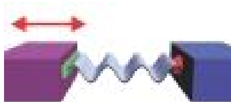
Рисунок 1 – Источник движется, приемник остаётся неподвижным

В случае движущегося источника эффект Доплера возникает из-за того, что изменяется длина волны, распространяющейся от источника к приемнику. Это хорошо видно на рис. 1 [1].