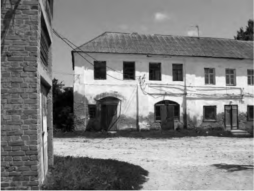
Рис.3. Ізяслав. Будинок на вул. Заславська, 33. Фрагмент. Фото автора (2010 р).

існуючі будівлі костелу, синагоги, скарбниці – стародавні архітектурні домінанти, які поєднують минуле з сучасним. Невід’ємним елементом середньовічного міста була торгова площа – Ринок.