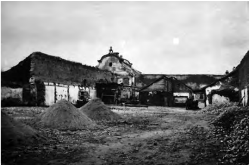
Рис. 6. Заслав. Руїни торгових рядів. Фото 1926 р.

З архівних джерел відомо, що в 1764 р. у Старому Заславі перебудовується ринок, який тепер становив окрему міську дільницю, оточену дерев'яним парканом. В середині ринок поділявся на окремі вулиці з дерев'яними крамницями та мурованими магазинами. [12]. Чи можна видовжені будинки, про які ми згадували, ототожнювати з цими крамницями? Є інший варіант: ринок з ратушею стояв ближче до костелу, а два інші прямокутні будинки – це заїзди, розповсюджені у Заславі (до речі збереглися і деякі фото).