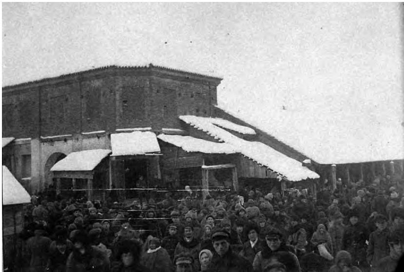
Рис.2. Ізяслав. Будинок на вул. Заславська, 33. (1928 або 1929 р).

молодшої гілки роду Острозьких, і пов'язане з цим становлення їх головної княжої резиденції, торкаються документи з архіву князів Сангушків, (зберігається у Кракові). Аналіз цих матеріалів дозволить скласти повніше уявлення про монументальну забудову міста у XVI–XVII ст., до складу якої входили