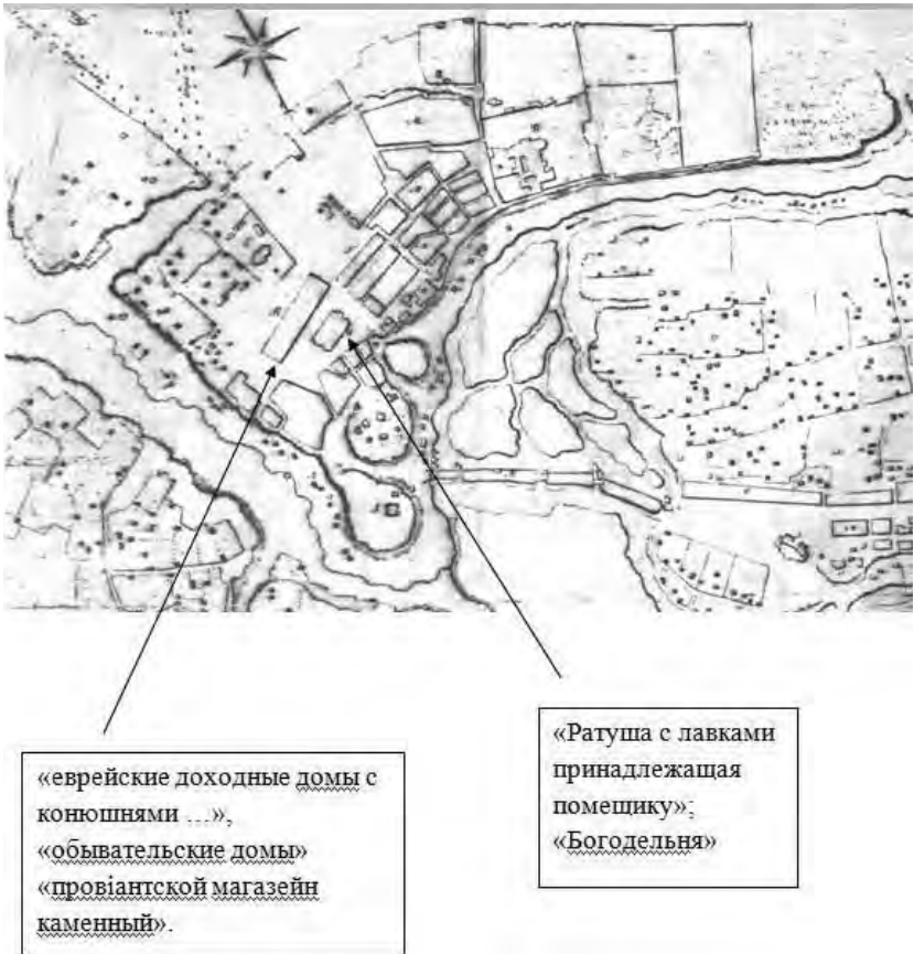
Рис.4. Фрагмент плану м. Заслав (90-ті роки XVIII ст.).

За спогадами П. Жолтовського: «Старый город был типичным местечком, облик которого сложился во времена старой Речи Посполитой. В центре – большая торговая площадь, на которой всегда было тесно во время ярмарок. Посреди площади – торговые ряды с тремя проходами. Они были построены