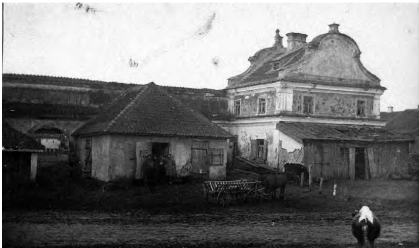
Рис. 5. Заслав. Ратуша. (1928 або 1929 р).

Локалізування торгових рядів XVIII ст., що не збереглися, є складним завданням. Підказкою може слугувати характерна форма у вигляді витягнутого прямокутника, та існуючий костел, що був до них «Ближе всего». На архівних планах міста (іл. 4), простежується прямокутний у плані елемент забу-