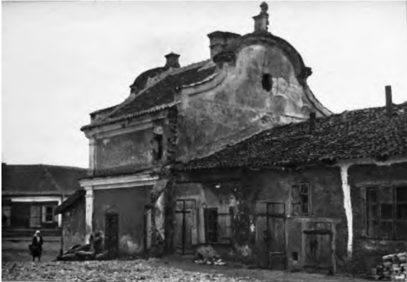
Рис. 7. Заслав. Ратуша. Фото 1926 р.

Повернемся знову до спогадів Павла Жолтовського: «Но вот проезжаем «цегельню», кладбище, въезжаем в «Старый город». Сначала у дороги мещанские усадьбы, мало чем отличающиеся от сельских хат, потом вас обступили местечковые дома, тесно скученные, без заборов, дворики. Деревянные каркасные, наполненные глиной, побелённые стены, черепичные крыши. Вот центральная площадь, замощенная глянцевым, истертым булыжником. В ярмарочные дни здесь тесно от возов, съехавшихся сюда окрестных селян.