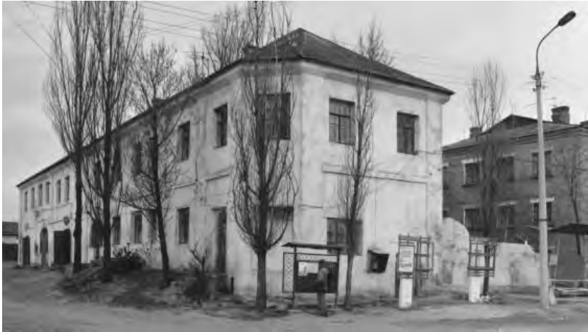
Рис.1. Ізяслав. Будинок на вул. Заславська, 33. (1983–1993 роки)