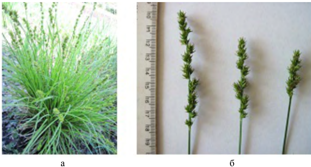
Рис. 5. Carex divulsa Stokes во второй год развития: а – молодая генеративная особь, б – соцветия.

Весной следующего года растения переходят в молодое генеративное возрастное состояние: во второй половине мая отмечено начало цветения (рис. 5). Таким образом, продолжительность виргинильного возрастного состояния составляет 155–170 дней вегетации. Молодая генеративная особь состоит из множества вегетативных и генеративных побегов, высота последних 36–45 см. Длина листьев 35–43 см, ширина 0,35–0,45 см. В целом, высота надземной части растений составляет 38–40 см, диаметр – до 60 см, многочисленные придаточные корни, разветвленные до второго, редко третьего порядка, проникают на глубину до 17 см.