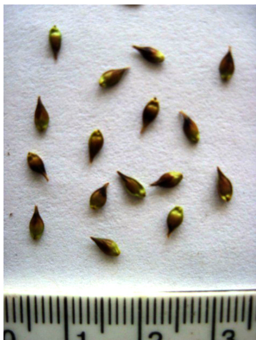
Рис. 1. Мешочки с плодами Carex divulsa Stokes

В условиях ДБС C. divulsa – многолетний летнезеленый травянистый короткокорневищно-кистекокорневой плотнодерновинный симподиально нарастающий поликарпик с розеточными прямостоячими побегами, 50–60 см высотой, до 90 см диаметром. Листья узколинейные, плоские, ярко-зеленые, жесткие, 27–46 см длиной и 3–4 мм шириной, высота генеративных побегов 48–65 см. Соцветие колосовидное, прерывистое, высотой 5,5–7,2 см, диаметром 1,0–1,5 см, состоит из 7–12 андрогинных, яйцевидных, в разной степени расставленных колосков. Цветение в середине мая, плоды созревают во второй половине июня. Реальная семенная продуктивность побега составляет 104,50 \pm 4,35 , коэффициент вариации – 13,17%. Семенная продуктивность всей особи определяется ее возрастом и потому сильно варьирует в зависимости от количества генеративных побегов. Мешочки продолговато-яйцевидные, плоско-выпуклые, с острым носиком, оливково-зеленые, по спинке темно-коричневые, длиной до 5 мм, шириной до 2 мм (рис. 1). Орешки уплощенно-яйцевидные, размеры их сильно варьируют: 0,23–0,29 см длиной и 0,15–0,19 см толщиной.