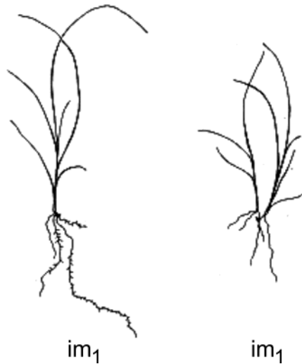
Рис. 3. Имматурные особи Carex divulsa Stokes с одним (im1) и с двумя (im2) первичными побегами.

Следует отметить, что определение нами возрастного состояния вышеописанных особей как имматурного небесспорно, поскольку связь особи с семенем продолжает сохраняться, хотя питание смешанным назвать трудно. Возможно, причина в том, что ткани мешочка разлагаются очень медленно. Все прочие морфологические признаки свидетельствуют в пользу данного определения: развитие листьев и корневой системы переходного типа, формирование вегетативного побега. Данное возрастное состояние продолжается 45–50 дней.