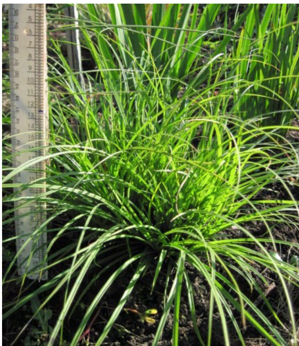
Рис. 4. Виргинильная особь Carex divulsa Stokes.

Со второй половины июля моноподиальное нарастание побега сменяется симподиальным, идет интенсивное образование вегетативных розеточных побегов второго порядка, и виргинильные особи, развившиеся из имматурных особей двух типов, становятся практически неразличимыми. И те, и другие представляют собой первичный куст высотой до 30 см, диаметром до 40 см, состоящий из 10–12 вегетативных побегов с 7–9 дефинитивными листьями длиной 25–30, шириной 0,4 см (рис. 4). В таком состоянии растения зимуют.