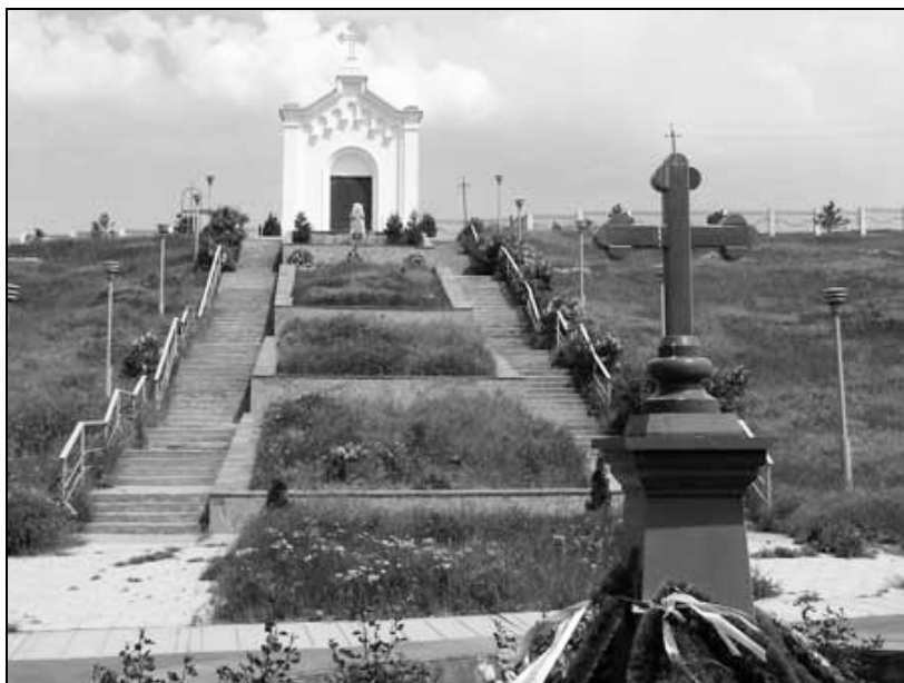
Рис. 3. Часовня во имя Св. Благоверного Князя Александра Невского на воинском кладбище