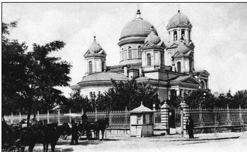
Рис. 1. Собор Святого Александра Невского