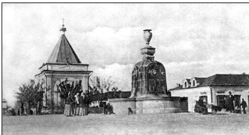
Рис. 4. Часовня во имя Св. Благоверного Князя Александра Невского на базарной площади возле фонтана