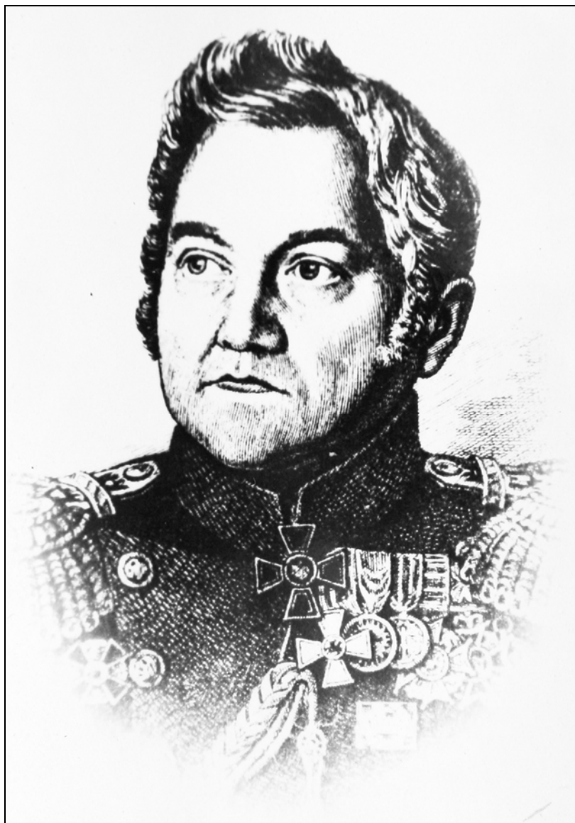
М. П. Лазарев