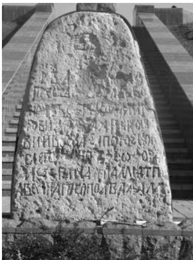
Надгробний камінь з епітафією на могилі І.Д. Сірка. Лицьова сторона. 2011 р.

Безпосередньо могила І.Д. Сірка знаходиться за 50 м від шосе Капулівка – Нікополь, біля підніжжя кургану (№ 3383). Його розміри: висота – 6,0 м, діаметр – 60,0 м, площа – 2826,0 м 2 . Довжина межі території кургану – 188,4 м. Курган називався «Сторожова Могила», оскільки в часи запорозького козацтва з його вершини велося спостереження за віддаленими підходами до Базавлуцької Січі (1594–1638 роки), Микитинської Січі (1639–1652 роки), Чортомлицької Січі (1652–1709 роки).