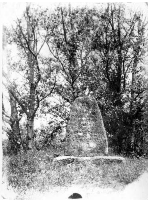
Могила І.Д. Сірка. Кінець XIX ст.

У радянський час постать Івана Сірка в історії козацької України показували фрагментарно і лише відповідно до вимог комуністичної ідеології щодо місця українського козацтва в минулому України. Тільки в останні роки існування СРСР та перші десятиліття незалежної України, коли могила І.Д. Сірка стала місцем Всеукраїнських урочистих заходів представників українського національно-визвольного руху, а в історичну науку прийшло «козацьке відродження», справи І.Д. Сірка стали одним із головних об'єктів дослідження українських істориків. Серед останніх