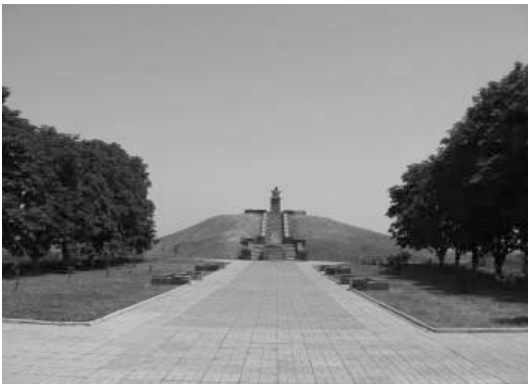
Могила І.Д. Сірка. 2010 р.

І.Д. Сірко – один із найулюбленіших козацьких героїв, який назавжди є в пам'яті українського народу [24, с.113–119]. Образ І.Сірка, прізвище якого означає «Вовк», висвітлюється не тільки в козацьких літописах, у подальшій науковій літературі, але й у художніх творах українських письменників В. Малика, Ю. Мушкетика, В. Кулаковського тощо.