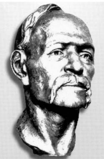
Кошовий отаман Іван Сірко у віці 50-60 років. Антропологічна реконструкція. Автор Лебединська Г.В.

23–24 листопада 1967 р. археолог Дніпропетровського історичного музею ім. І.Д. Яворницького Л.П. Крилова провела розкопки могили І.Д. Сірка. Більша частина останків І.Д.Сірка була перепохована у новій труні у вищезазначеному місці. Проте череп, 8 кісток, муміфікований мозок (наука не може пояснити цей унікальний факт) та пасмо волосся були таємно вивезені до Дніпропетровська [11, с. 4–6].