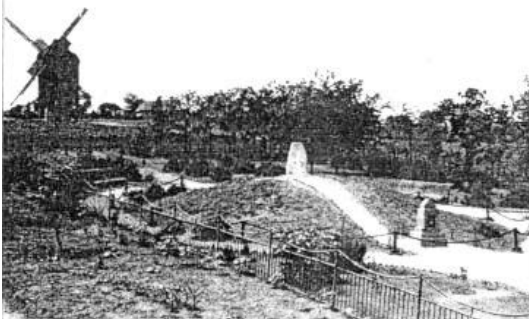
Загальний вигляд могили І.Д. Сірка і парку біля неї (с. Капулівка. 1950-ті роки)

Так, у 1663–1664 роках І.Д. Сірко двічі здійснив погром Перекопських укріплень татар і їх військ, вирушивши потім у гли-